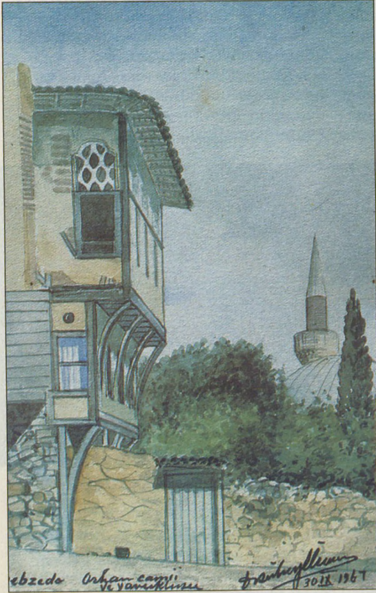
A. Süheyl Ünver'in 1967 tarihli bir suluboya resmi "Gebze'den Bir Manzara"

sanatı bile bir araç olarak gördü. İnsana kendi adresini gösterdi. İnsanı kendi içindeki gizli varlıkla dost kıldı. Belki onun kendisine tahmil ettiği misyon buydu. Kendisinin bir ca-