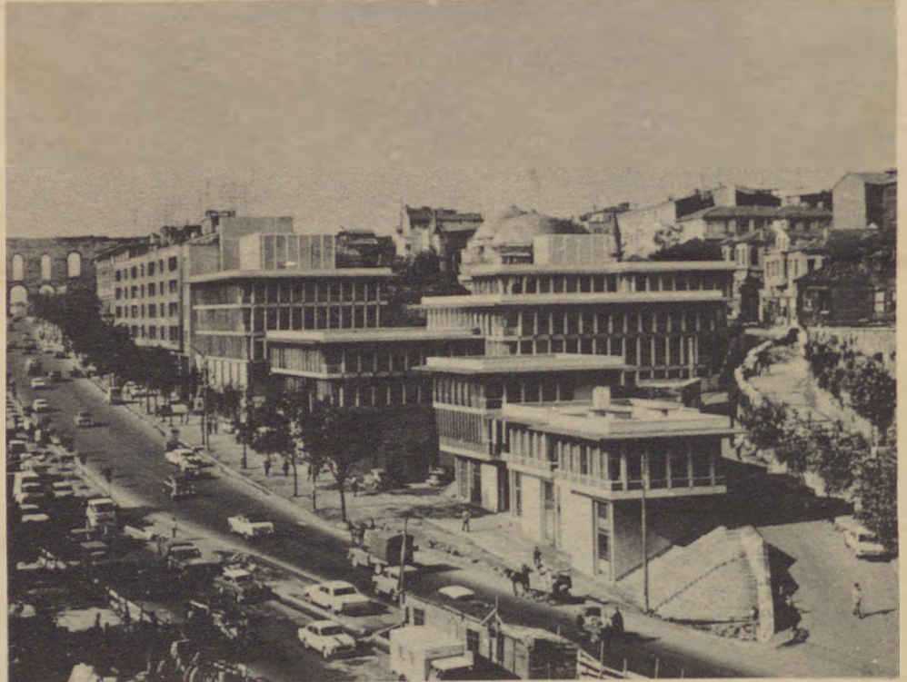
Sedat Hakki Eldem, Sosyal Sigortalar Kurumu Binası, Zeyrek, İstanbul

Yenileşme hareketleri resmi, askerî binalarda ve sarayda başlamıştır.