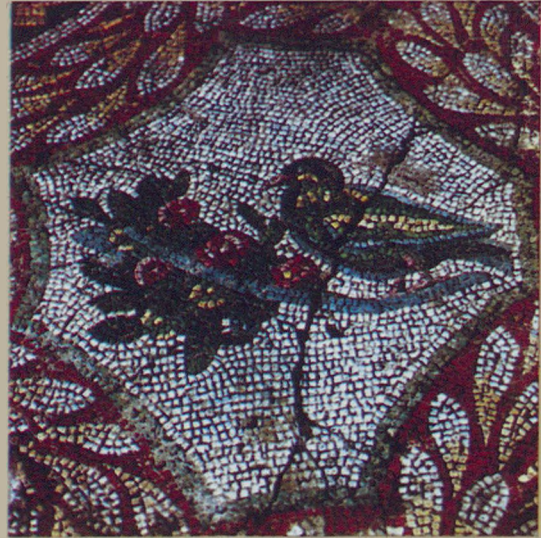
Kuşlu Panodan detay (Belediye Sarayı Kazısından)

Detail of a bird panel (from the Cih Hall excavations)