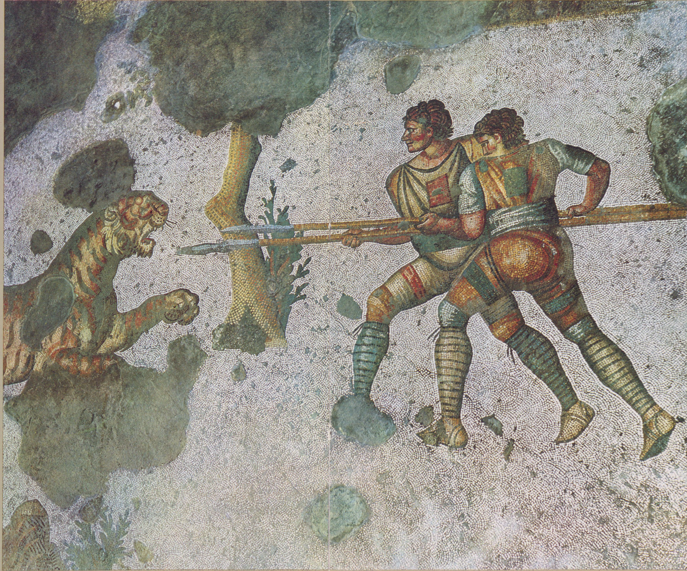
Kaplan ile mücadele eden mızraklı iki avcı (Büyük Saray Mozaiiklerinden)

Detail of a bird panel (from the Cih Hall excavations)