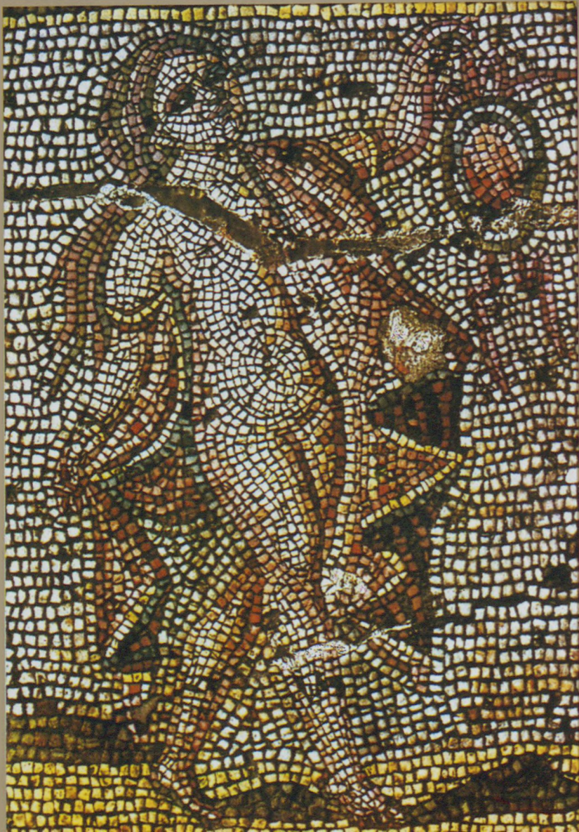
Dansöz (Belediye Sarayı Kazısından) Dancer (from the Cith Hall excavations)