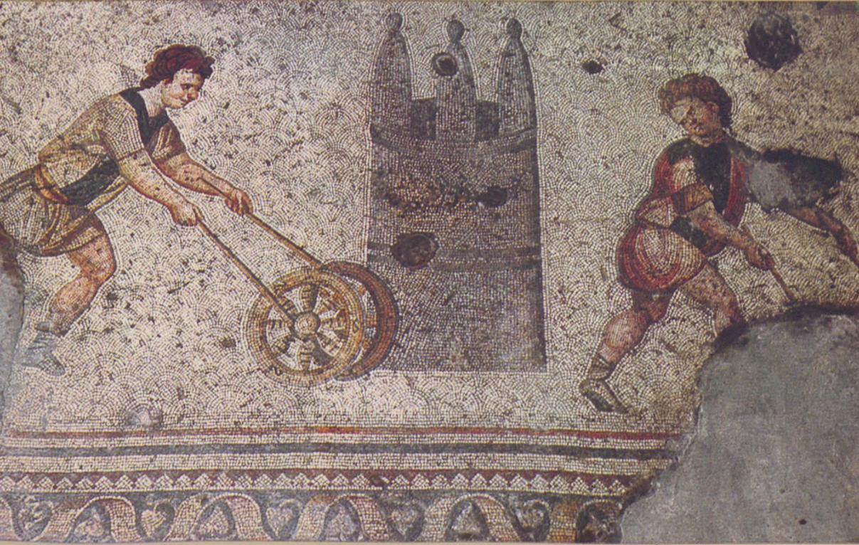
Çember çeviren çocuklar (Büyük Saray Mozaiklerinden) Children bowling a hoop (Mosaic in the Great Palace)

Mozaik Müzesi, Sultanahmet'te, Ayasofya, Arkeoloji Müzeleri ve Topkapı Sarayı Müzesi ile oluşan müzeler topluluğunun bir parçası durumunda olup, yerli ve yabancı gezginlerin dikkatini çekmekte ve uğrak yeri olmaktadır.