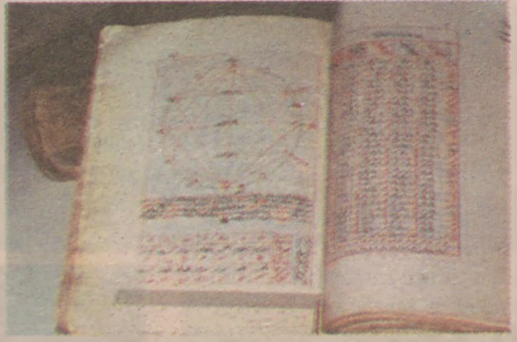
Cedvel-i Mukantarat Yazarı: Şehit Mehmet Paşa Camii muvaffığı. Yılı: H. 1201-M. 1789. Dili: Türkçe. Konusu: Astronomi

önemli etken olan Mühendishane-i Berri-i Hümayun Kütüphanesi'nden gelen kitaplardan bulabildiklerini, özellikle yazmaları; gerek kendi depo ve dolaplarından seçerek, gerekse İTÜ Bilim ve Teknoloji Tarihi Araştırma Merkezinden alarak, kütüphanesinin ayrı bir köşesinde hem korumalı, hem de sergilemelidir. Bunu İTÜ'nün bir görevi olarak düşünüyorum. Bu sayede başta öğretim üyeleri ve öğrencileri olmak üzere ziyaretçilerine de okullarının geçmişi ile ilgili bilgi aktarmış olacaklardır.