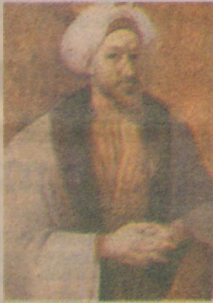
Erzurumlu İshak Mühendishane başhoca olarak görev yaptı, 7 dil biliyordu.

(*) Dr.: Bahçeşehir Üniversitesi Kütüphane ve Belgeleme Merkezi E-Posta: kerzurum@bahcesehir.edu.tr