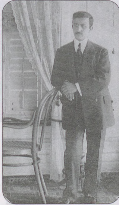
Sermet Muhtar Askeri Müze'de göreve başladığı yıllarda

sinde, eski İstanbul bütün ihtişamı ile güzelliği ve geleneğiyle yaşamaktaydı.