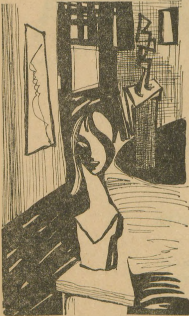
Cavidan Y. Erten