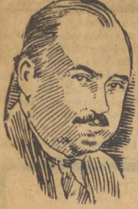
Büyük Türk mütefekkeri Ziya Gökalp

Fakat 1789 Fransız İnkılabının Avrupa sınırlarını aşan milliyetçilik hareketi, bu ideolojik cereyanları iflâs ettirmişti. Avrupada vücut bulan milliyetçilik hareketleri, Osmanlı İmparator