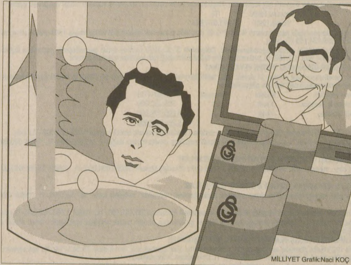
MİLLİYET Grafik:Naci KOÇ

Bayramda Marmaris'e gidiyorum. Bir süre tatsız gelişmelere kullıklarımı tıkayacağım. Sizlere de iyi bayramlar dilerim