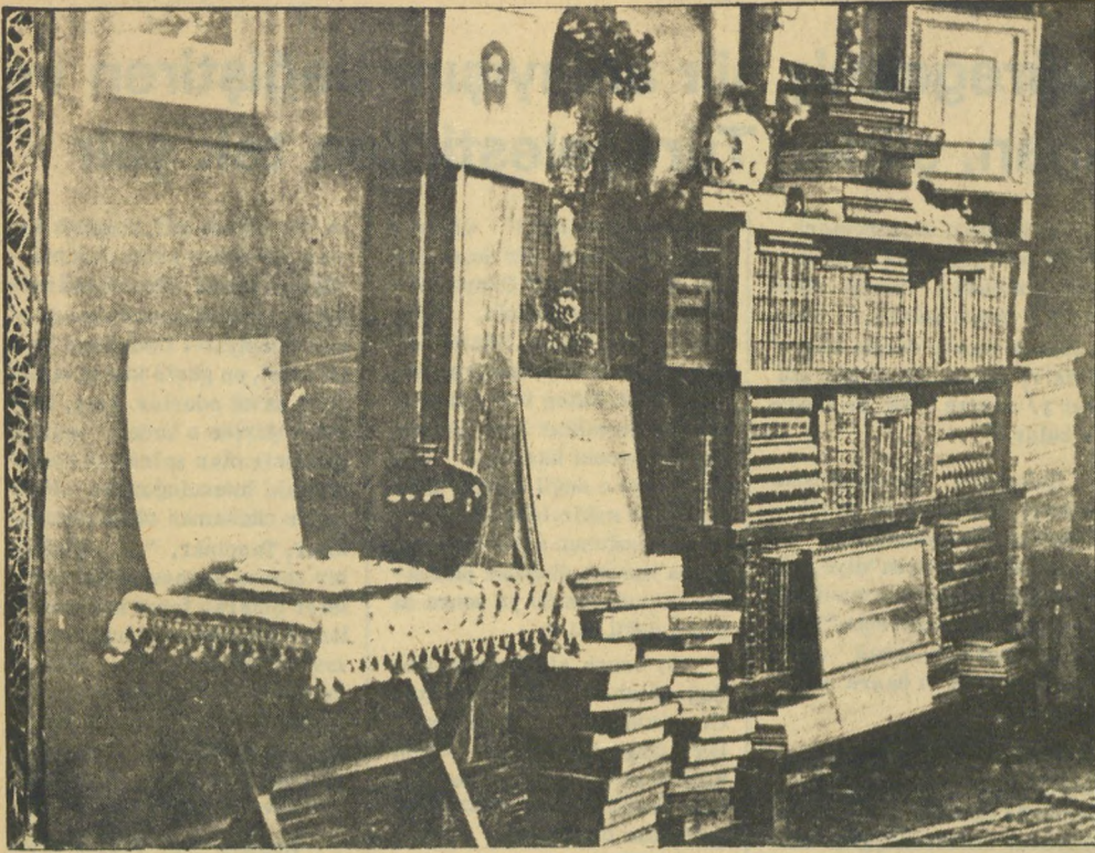
Çalışma odasının sağlığında çekilen fotoğrafı

lur. Ona göre incelenmeye - cek, eleştirilmeyecek, irde- lenmeyecek, yargılanmaya - cak şey yoktur. Daha sonra karşısına çıkan düşünceyi a- kıl ve mantık süzgecine vu- rur: "Düşünüp işlemek ayı- nımdır". Buradan giderek bunları bilimin tartacına vu- rur, sonuç neyse ona inanır. Böylelikle Fikret, 19. yüzyıl idealist bilgelerinin düşünce- sini aşarak materyalist dü- şünceye varır. Artık Fikret, bir gerçek olarak mevcut o- lan yaradılışa, varlığa inan- maktadır: "Süzerim fitratı hayran hayran". Cennet ve Tanrı düşüncesinden uzaktır. İnsan da bütün varolanlar gi- bi varlığın ürünüdür. Bu ne- denle Fikret, kendisiyle bir kaya arasında fark görmez; "Ben beni bir kayadan far- kedemem". Onun kitabı "ta- biat levhalarının kitabı" dır. Ve Fikret'e göre gerçek din, "İnsanca yaşama dini"dir. "Tarih-i Kadim", "Tarih-i Kadime Zeyl" ve "Halûk'un Amentüsü"nde bu düşüncele- ri sergilenir.