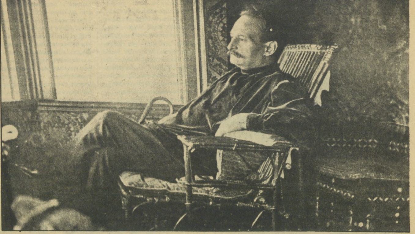
Fikret'in bu fotoğrafı 1915 haziranında, ölümünden iki ay önce çekilmiştir