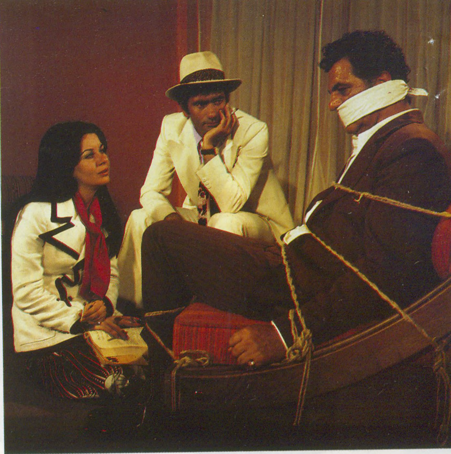
Yarın Son Gündür'de. 1971. Siyasi amaçlı adam kaçırma eylemlerinden esinlenilmiş iyi kalpli haydut rolünde.

Aslında geçen yıl gösterime çıkan "Umut"un performansı, Yılmaz Güney filmlerinin ikinci dönemi için bir ölçü olacak nitelikte. Filmin dağıtımını üstlenen Efes Film yetki-