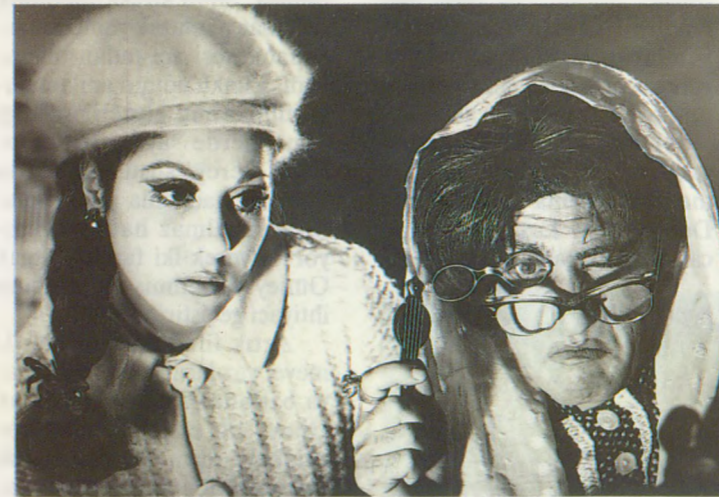
Kibar Haydut'ta. 1966. Kadın kılığında Yılmaz Güney. Bir efsane-nin katı kalıplarının da kırılabilceğini gösteriyor. (Agah Özgüç arşivinden)

Özgüç'e göre Kahraman, gazetelerde çıkmış konuşmaları, Yılmaz Güney'le ilgili daha önce yayımlanmış bazı bilgileri alıp sanki kendi bulmuş, kendi konuşmuş gibi yayımlamış. "Kaynaklara saygılı ol-