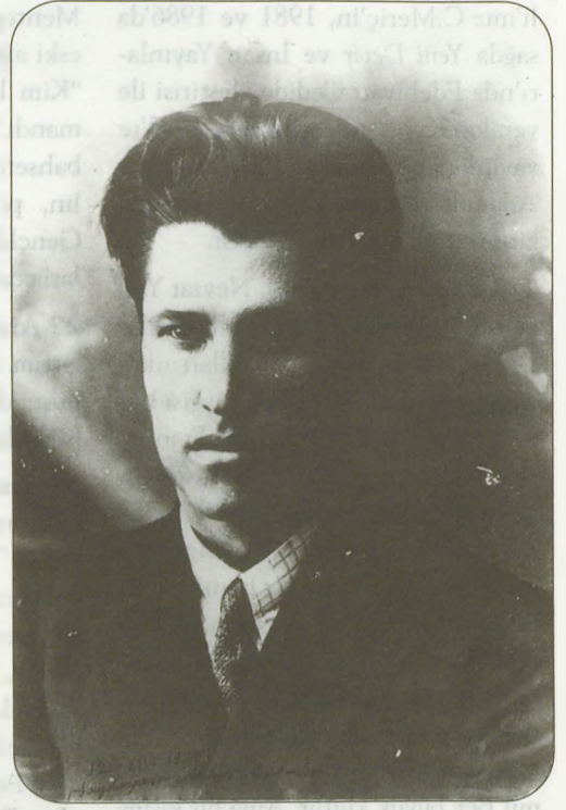
Dr. Hikmet Kıvılcımlı 1930'lu yıllarda

15 Ocak 1982 • Akademi Kitabevi'nde Cemil Meriç'in imza gününe