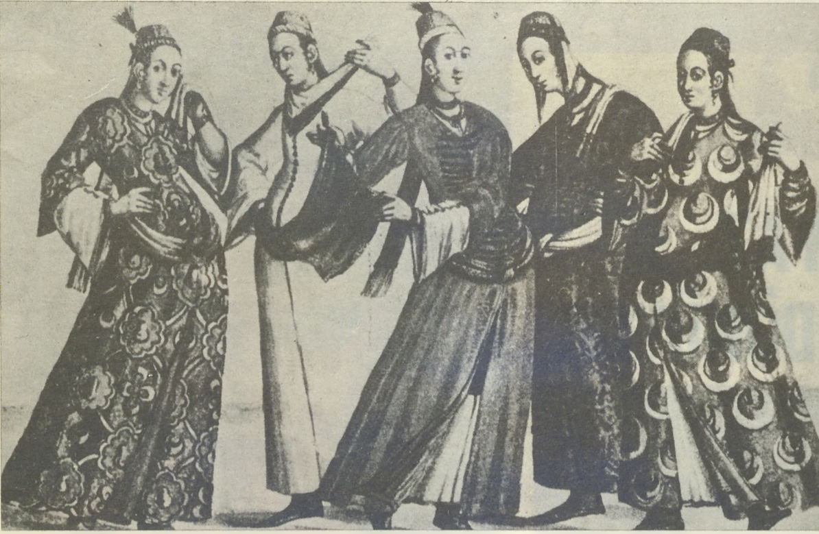
Çok eski bir gravürden alınan bu resimde dans eden Türkmen kızları görülmektedir. Türkoğlu, nice yüzyıllardan beri Tiyatro Sanatının yanısıra dansa da yaşantısında pek büyük bir önem ve değer vermiştir.

miş, merakını uyandırmamış. Ta ki Köprülüzâde Mehmet Fuat bey isminde bir genç çıkıp da «Bizim ne-lerimiz varmı?» diye tetkikata girişip eser verene kadar... Tanrı rahmet eylesin Atatürk'e, o hıza getirdi de genç bilginlerimizin, modern bir kafa ile çalışan müverrihlerimizin yetişmesine yol açtı. Bu hususta Necip Âsim beyi de rahmetle anarım.