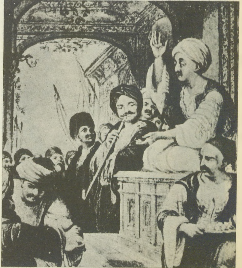
Türk sanat tarihinin bir diğer siması da Meddah'tır. Tarihi bir gravürden alınan yukarıdaki resimde bir kahvehanede hikâye anlatan Meddah görülmektedir...