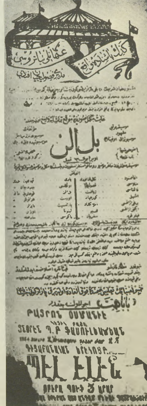
Meşhur Gedik Paşa Tiyatrosunun temsilleri ile ilgili yarısı Türkçe, yarısı ermenice eski bir duvar ilanı

dünya yüzünde galiba biziz. Daha doğrusu bizlermişiz. Benim yaşımda olanlar, ilk ve orta mekteplerde Türkün tarihinin Osman Gazi ile başladığını okumuş ve bugünkü yurdumuzu türkleştirip ve ikibuçuk asırdan fazla bir zaman bütün sanatıyla hükümlan olan Selçukilerden bahsedene bir tarih kitabı okumamış, okutulmamışlardır. Anadolu Türk Selçuk devletini bilmediğimiz gibi, aşiretin nereden ve nasıl geldiğini dahi araştırmamış, Ertuğrul Beyin baba isminin Gündüz Alp olduğunu dahi öğrenememiş ve Caber Kalesi civarında «Türk mezarı» diye anılan türbede yatan Anadolu fatihi Selçuklu Süleyman Şah'ı, Osman Gazi'nin dedesi Ertuğrul beyin babası zannetmiş durmuşuz. Hâl böyle iken, Türkün geçmişteki tiyatrosunu, müziğini, edebiyatını araştırıp bulmak kimin aklına gelir?... Fakat 19'uncu asrın başlarından itibaren Avrupalı ilim adamlarının aklına gelmiş, eski Türk kavimlerinin dönüp dolaştıkları yerlere kadar gidip onların dişlerine takarak milletimizin menbasını araştırmışlar, onlar hakkında edindikleri bilgileri yazmış çizmişler amma hiçbirimiz bizim ulemâ için bir örnek olmamış, hiç bir eser bizim bilgilerin nazarına çarpma-