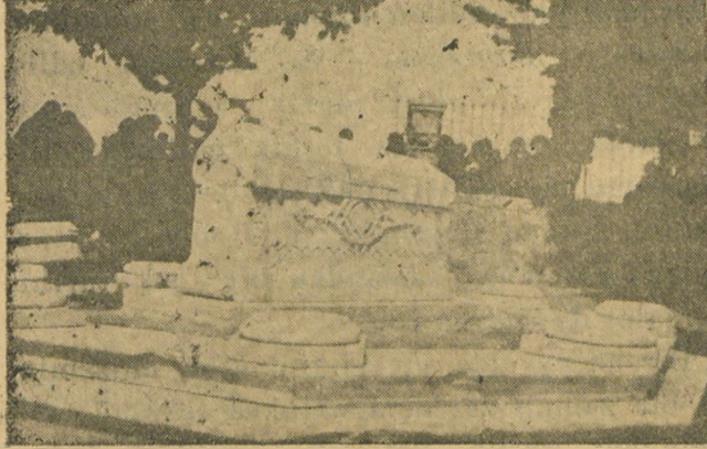
Namık Kemal'in Bolayırda bulunan üstü yıkık kabri