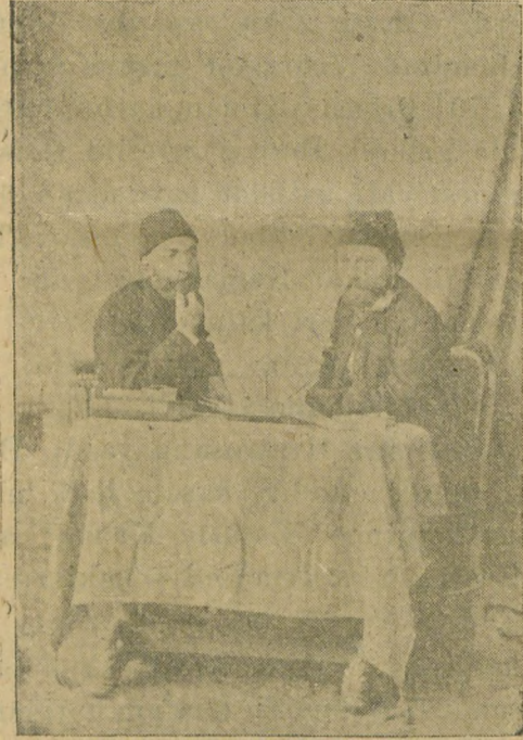
Ziya paşa ve Namık Kemal kanunu esasî encümeninde

Kemal öyle bir şairdirki zulüm dinen istibdat dinen ejderlere tek başına karşı durmaktan ürkmemiş, çelikten mısralarını mahalli tarafında kollanılan kılıçlar gibi sultanların mel'anetle dolu kafalarına vurmaktan çekinmemiştir.