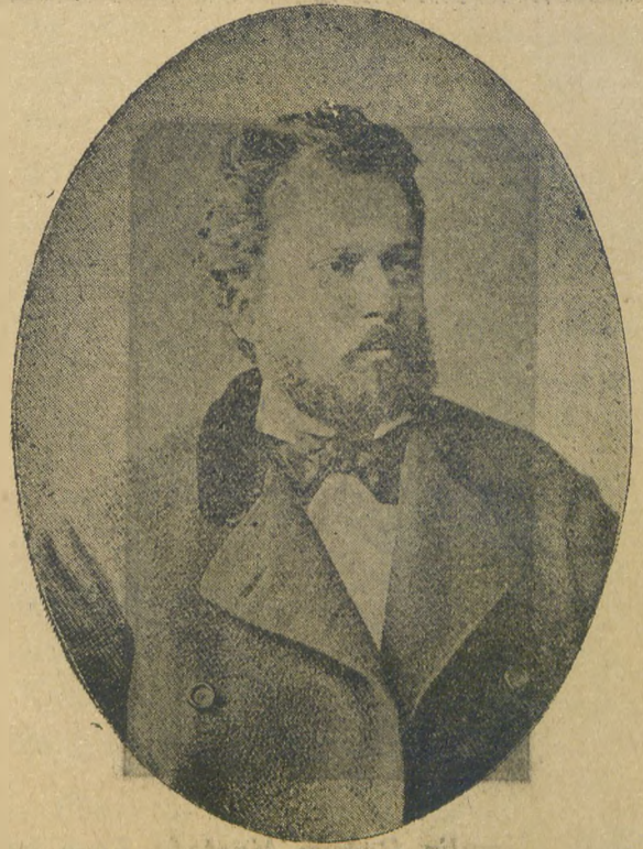
Namık Kemal'in Sakıza nefyolunduktan sonra alınan bir resmi

Bu hadiseden ürken saray. Abdülazizin (15 Nisan 1873) tarihli meşûm fermanı ile kemali kıbrısta magosa zindanına Kalebent olarak nefi etti. Kemal bu sıtma diyarında türlü türlü hastalıklar çekerek tam otuz sekiz ay yarı aç, yarı tok ve her şeyenden mahrum bir halde inledi. Bütün bu hastalık ve zaruretlere karşı büyük Kemal zerre kadar meyus olmadı. Zaten ölümden yılmıyan bir insan maddi ıztıraplardan korkar mı?..