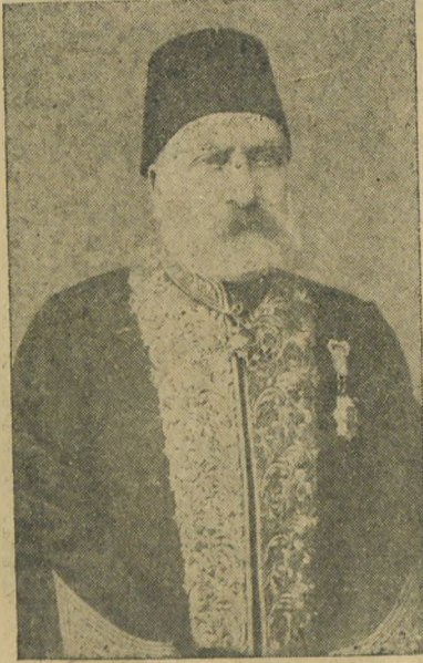
Namık Kemal'in Babası Mustafa Asım bey

1888 senesi 2 kânunuevvelinde bu büyük vatan şairi ebedi uykusuna daldı. [**]