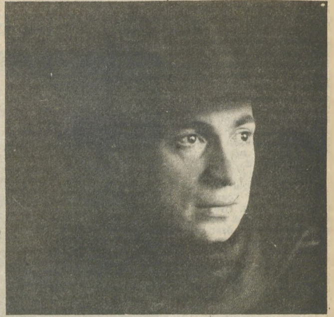
1918'de 26 yaşında

ğunuzda birleşiyorlar. İyi bir roman hikâye yazarı da olabiliydiniz, oyun yazarı da. Oyun yazmayı hiç denemediniz mi?