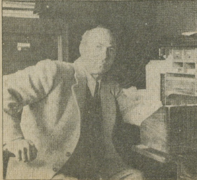
Şehir Tivatrosu'ndaki çalışma odasında (1942)

Çekingenliğinizden söz etmiştik biraz önce. Yalnız- lığı seviyorsunuz, kalaba- lıktan hoşlanmıyorsunuz.