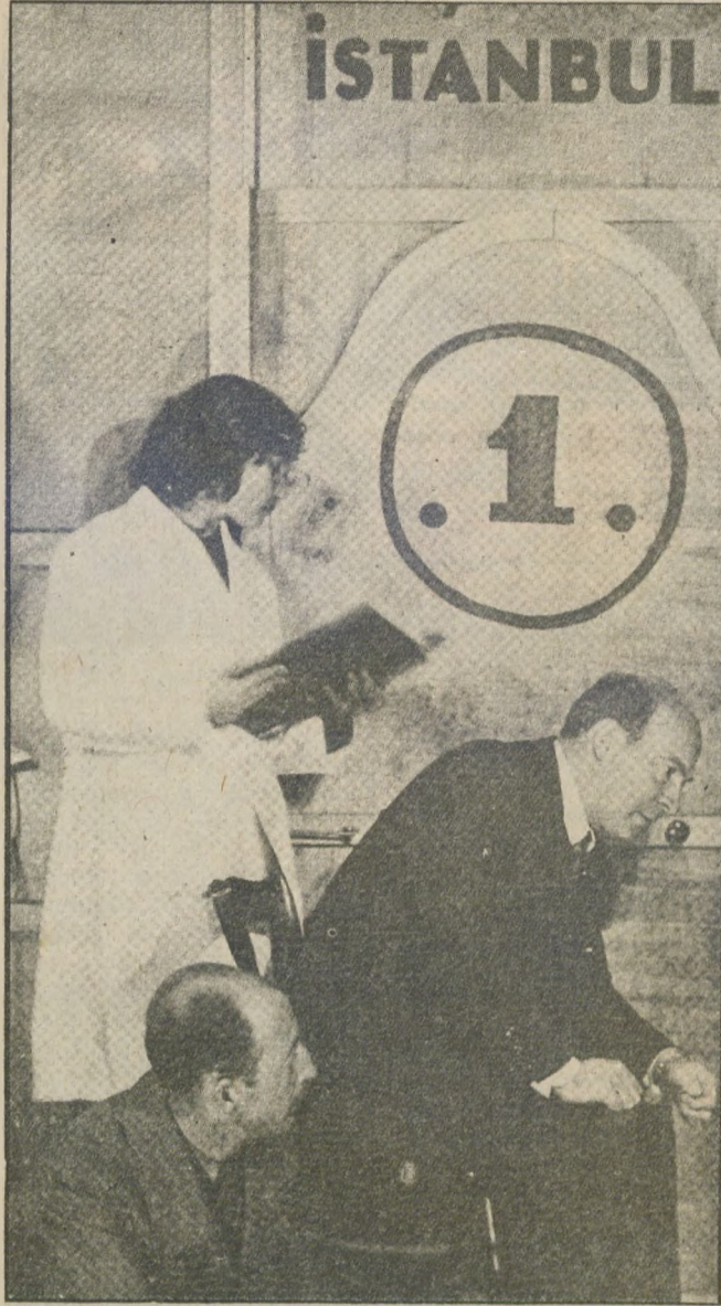
Dram Tiyatrosu kulisinde oyun izlerken (1941)

Önüme geleni piyes yazmaya teşvik ederdim, ama yazdıklarına hiç karışmazdım. Şurasını burasını çıkar, ya da değiştir demedim, hiçbir yazara. Musahipzade Celâl'in ilk piyesleri çok ilkeldi. Sözleri duymaya tahammül edemezdim bazen. Ama çok çalışırdı, yapabileceğinin en iyisini yapar, getirirdi. Hüseyin Rahmi tiyatroya gelirdi. "Ne olur, piyes yaz" derdik. Yazdı, getirdi bir gün. Neyyire çok iyi oynadı o piyeste. Hüseyin Rahmi heveslendi, yazmaya devam etti. Yakup Kadri'nin de yazmasını istedim, yazdı. Reşat Nuri'nin dili de iyiydi, tekniği de. Yahya Kemal'in piyes yazmasını çok isterdim. Hep söz verirdi, ama yazmadı. Necip Fazıl'ın ilk piyesi (Tohum) kötüydü. Teşvik etmek için sahneye koydum ve başrolü oynadım. Ama sonra "Bir Adam Yaratmak"ı yazdı. Güzel piyestir "Bir Adam Yaratmak". Necip Fazıl memnun olmazdı. Her gece,