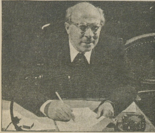
Tepebaşı Tiyatrosu'nda bir provayı izlerken (1959)

Tanin gazetesinde çıkışı, ilk sahneye adım atışım ve Berlin'de ilk rejisörlük sözleşmesinin teklifini alışı. Fakat bunlardan daha mutlu bir an: gelecek kuşaklar için bir tiyatro okulu açtırmak isteğimi, Atatürk'ün kabul edip hemen yarım saat sonra başvekiline direktif verdiği andır.