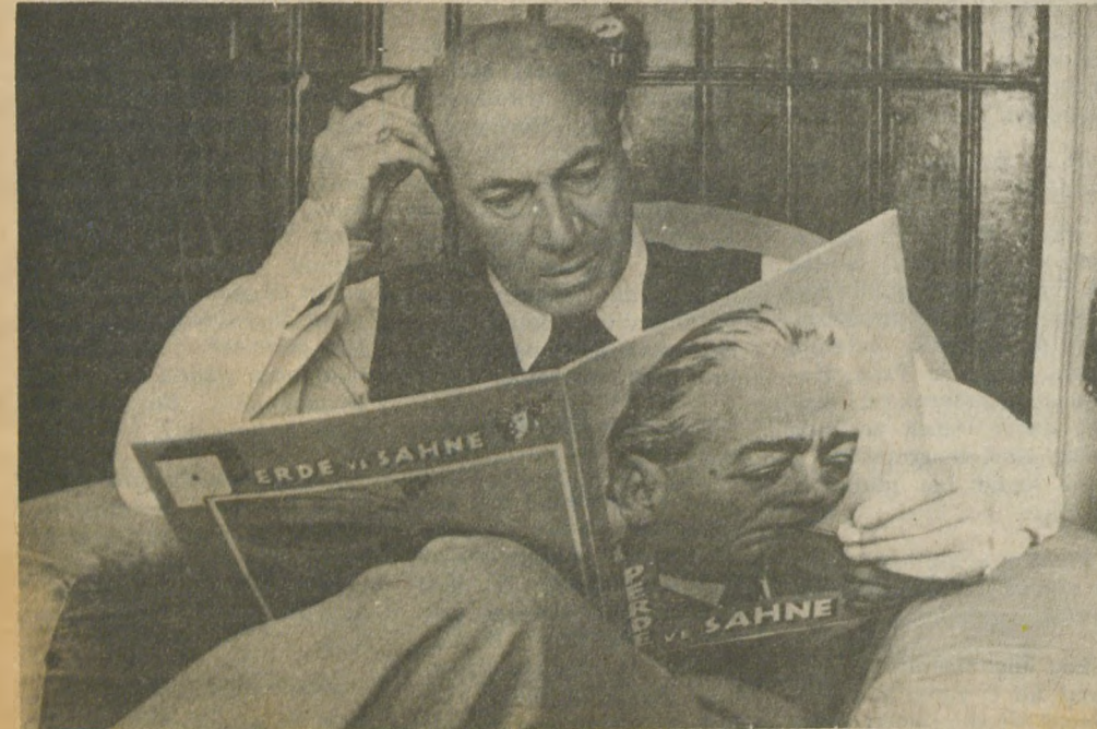
Arkadaşlarıyla birlikte çıkardığı "Perde ve Sahne"nin ilk sayısını incelerken (1941)

Vicdanları aldatılan saf halkı ve çıkarları için "Din-İman" diye diye masum