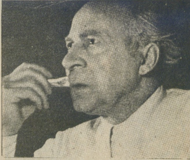
40. Sanat Yılında "Büyük Baba"ya hazırlanırken (1949)

1919'dan 1953 yılına değin sinemayla uğraştınız. 35 film yaptınız. Rusya'da, Almanya'da filmler çevirdi-