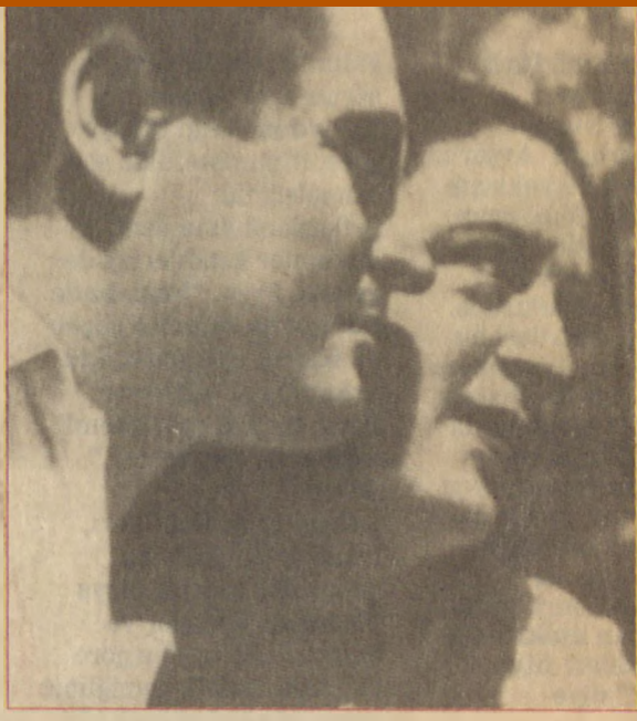
Nazım Hikmet ve Hatice Piraye Altınoğlu...16 yıllık evlilikte sadece üç yıl beraberlik...