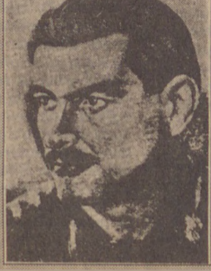
Nazım'ın çizgisiyle Kemal Tahir