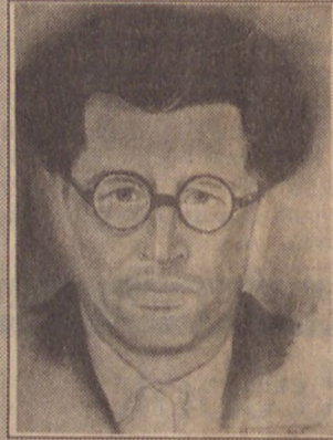
Nazım'ın fircaşısından Hikmet Kıvılcımlı