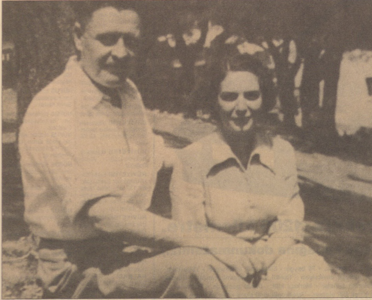
Münevver Hanım'la aşk ilişkisinin sona ermesi Nazım için bir darbe olmuştu... Olayı protesto etmeye kalkan Nazım'ın bu hareketi ise siyasal amaçlı bir eylem olarak değerlendirildi...