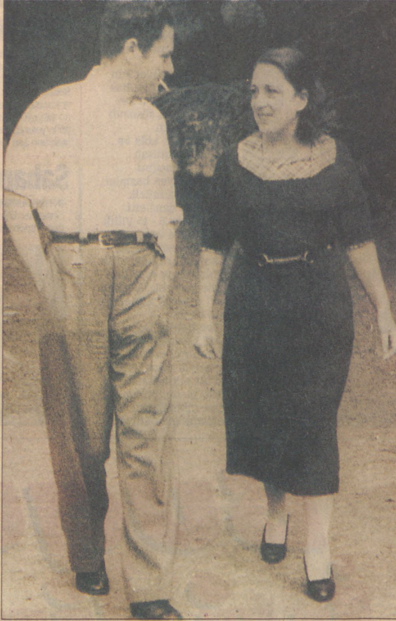
Nazım Hikmet, Piraye Hanım 1935'lerde Erenköy'deki köşkün bahçesinde

1924 yılı yazında Türkiye'ye dönen Nazım Hikmet, aslında bu raya bir görevle gelmiştir. Moskova'dayken üyesi olduğu Türkiye Komünist Partisi'nin "Toparlanış Kongresi"ne KUTV delegesi olarak katılacaktır. Nitekim 1 Ocak 1925'te Akaretler semtinde bir evde gizlice toplanan TKP'nin ikinci kongresine katılarak partinin Merkez Komite üyeliğine seçilir. O yılın Mart'ında Doğu'daki Kürt isyanı üzerine çıkarılan "Takrir-i Sükun" yasasına dayanılarak mensubu olduğu partiye yönelik takibat üzerine, kısa süre İzmir'de saklanır. Oradan da tekrar Sovyetler Birliği'ne gider. Ankara İstiklal Mahkemesi tarafından giyaben 15 yıllık kürek cezasına mahkum edilir. 1927'deki TKP tutuklaması üzerine İstanbul Ağır Ceza Mahkemesi tarafından yine giyabında 3 ay hapse mahkum edilir. 1928'de partili arkadaşı Laz İsmail'le birlikte Sovyetler Birliği'nden Hopa'ya pasaportsuz geldiklerinden tutuklanır. Ankara Ağır Ceza Mahkemesi'nin kararıyla 3 ay hapse mahkum edilir. Hopa - Ankara - İstanbul arasında geçen tutukluluk süresinde cezasını tamamlamış olduğundan 1928 yılı sonbaharında tahliye edilir. İstanbul'da, Babıali'de "Resimli Ay"da gazeteciliğe ve yazarlığa başlar. Bu dergide yayınlanan; eski şiir anlayışını yıkan; yeni, sol içerikli şiirleriyle popülaritesi hızla artar. Bir yandan da TKP içindeki gizli faaliyetlerini sürdürmektedir.