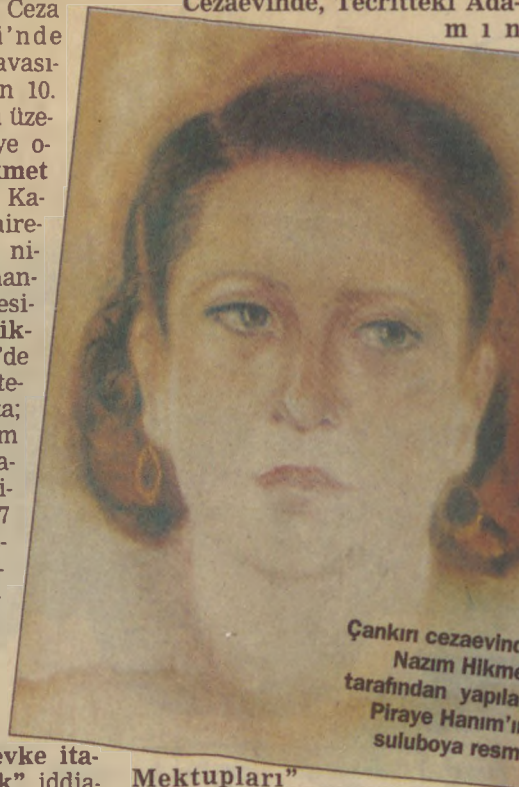
Çankırı cezaevinde Nazım Hikmet tarafından yapılan Piraye Hanım'ın suluboya resmi

Bursa Ağır Ceza Mahkemesi'nde süren bu davasının Cumhuriyet'in 10. yıl affıyla düşmesi üzerine 1934'te tahliye olan Nazım Hikmet 31.1.1935 tarihinde Kadıköy Evlendirme Dairesi'nde Piraye Hanım'la nikahlanır. 1936'da Cihanşir'de bir apartman dairesine yerleşirler. Nazım Hikmet bir yandan Babıali'de "Tan" ve "Akşam" gazetelerinde yazarlık yapmaktadır. Öte yandan İpek Film stüdyosunda çalışmaktadır. Hayatı bu tempo içerisinde sürüp giderken, 17 Ocak 1939 gecesi konuk olarak gittiği bir evde gözaltına alınarak Ankara'ya götürülür. Askeri Mahkeme tarafından tutuklanır. Harp Okulu Askeri Mahkemesi tarafından "Birden ziyade askeri şahısları... mafevke itaatsizliğe sevk ve tahrik" iddiasıyla açılan davada 22'si askeri öğrenci, 7'si sivil olmak üzere 29 kişiyle birlikte yargılanarak 15 yıl ağır hapse mahkum edilir. O yılın yazında gene aynı iddia ile askeri sivil 27 kişi birlikte yargılandığı Donanma Davası'nda da 29 Ağustos 1938'de 20 yıl ağır hapis cezası-