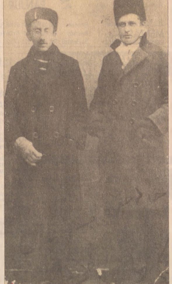
Nazım Hikmet evlilikle sonuçlanan ilk aşkının tanığı çocukluk ve gençlik arkadaşı Valâ Nurettin'le Anadolu'ya ilk geçişinde, 1921 Kastamonu...