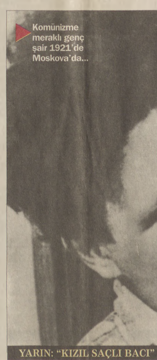
YARIN: "KIZIL SAÇLI BACI"