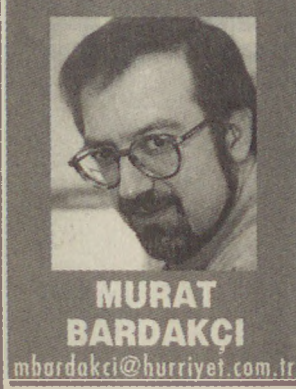
MURAT BARDAKÇI mberdakci@hurriyet.com.tr

Bu yazı, Türk Edebiyatı'nın ve Türk Müziği'nin üç büyük isminin 1930'lu senelerde beraberce yarattıkları ama bugün neredeyse unutulmuş olan bazı eserlerinin pek bilinmeyen öyküsüdür: Sözlerini Nazım Hikmet'in yazdığı, Mesud Cemil'in bestelediği ve Münir Nureddin'in orkestra