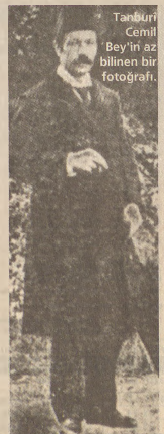
Tanburî Cemil Bey'in az bilinen bir fotoğrafı.

Gökler geri alıyor yeryüzünden sesini. Şimdi geniş alnında ebedin gölgesi var! Başında ağlayanlar sonuncu bestesini, Ağır ağır kapanan gözlelerinden duydular!..