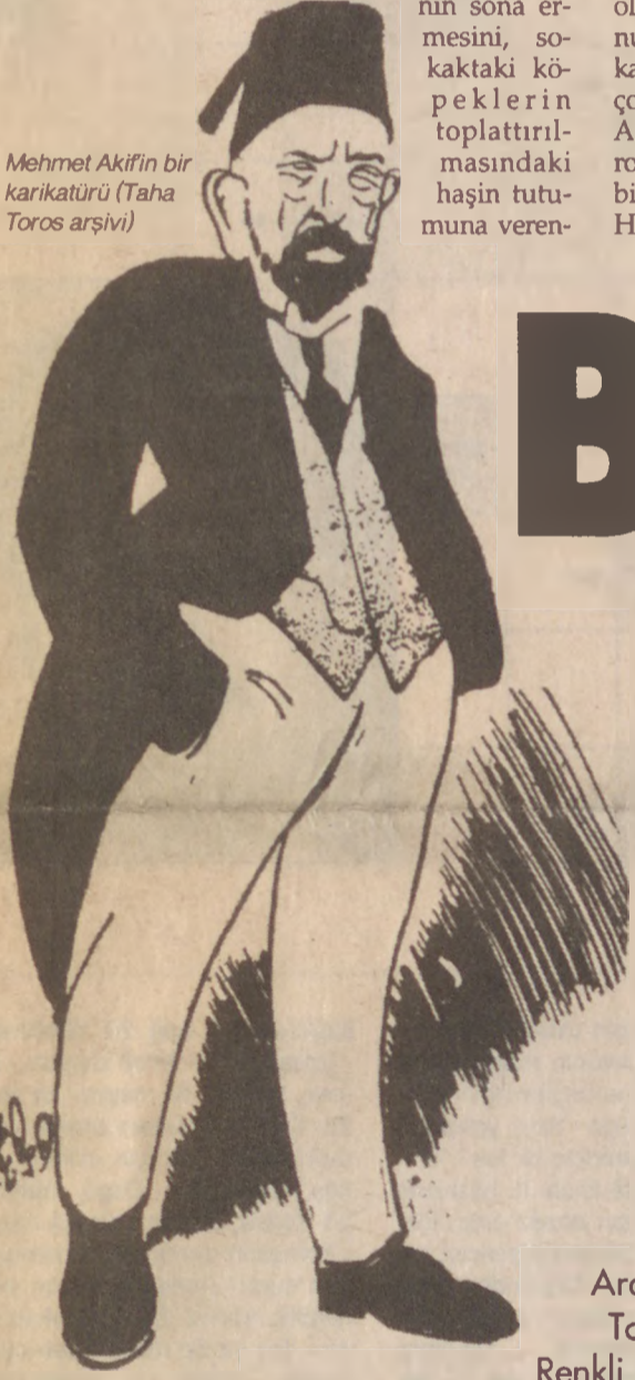
Mehmet Akif'in bir karikatürü