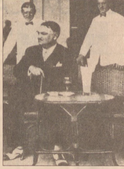
Yahya Kemâl (solda), (Taha Toros arşivi), Namık Kemâl (altta).

Ve Abdülhak Hâmid ve olmazsa olmaz Lüsyen Hanım. Sakillik abidesi bir öykü. Atatürk Türk kadının eşitlik hakkı vs. konularında sohbet ederken Abdülhak Hâmid, "Efendimiz Lüsyen cariyeniz, bu bakımdan Türk kadınlığının mükemmel bir örneğidir" diyesi oluyor, Toros'un aktardığına göre bununla yetinmeyip "Belçika ve Fransız karşını Lüsyen hanımdan bu konuda çok yararlanılabileceğini" söylüyor. Atatürk de feci tersliyor Hâmid'i. Toros'un aktardıklarından pek de sevimli bir portre çıkmıyor ortaya. Lüsyen Hanım'la aşklarının öyküsü bilindiği