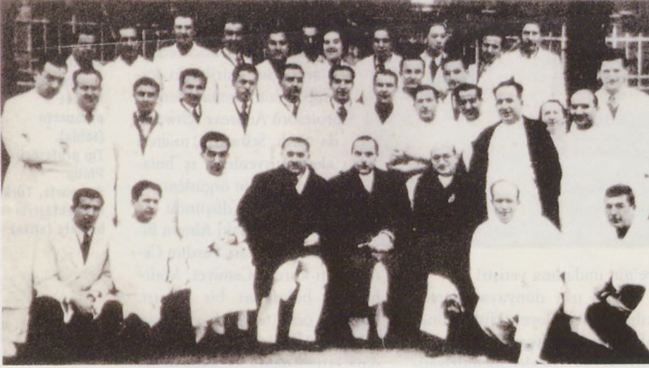
Tıp profesörü Rudolf Nissen, İstanbul Cerrahi Hastanesi'nde meslektaşları ile (üstte). Prof. Leo Spitzer ve öğrencileri piknikte (altta).

dersi Almanca anlatıyor; bazen asistanı ama çoğu zaman çevirmen, anlatılanları öğrenciye aktarıyor, hatta çoğu çevirmen Almanca bilmediği için, üçüncü bir dil devreye giriyordu.