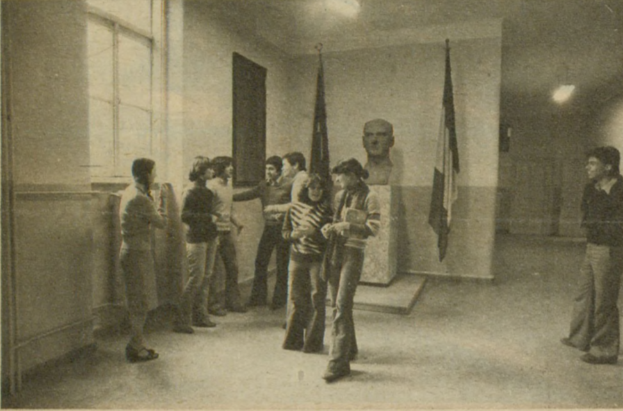
ÖĞRENCİLERİN teneffüs yerlerinde bir Atatürk köşesi hazırlanmıştır. Genellikle kitaplıklarda kurulan bu köşenin ortalıkta olması çok daha iyi.

«... Okulda göreve başladığım ilk gündü. Müdür Beyden aldığım talimatla, ilk dersimi vereceğim sınıfa yöneldim. Henüz binanın iç bölümlerini ve gerekli köşe bucağı bilmiyordum. Tarif üzere uzun koridorda ilerleyip belirtilen dersliğin kapısına geldim. Ne var ki kapalı kanadın ardında gizlenen duvarların arasından oranın bir sınıf, toplu haldeki öğrencinin ders odası olduğunu (alışılmış anlamda!) kanıtlayan en ufak bir belirti yoktu. Yani ses adına en ufak bir çıtırtı, fısıltı ya da feryat fiğan yansııyordu. Yanlış bir yere geldiğimi sanıp döndüm, uzaklaştım. Ama koridorun sonuna varmadan bir kuşku düştü içime. Ne olur ne olmaz diyerek bir daha geriye yönelip aynı odanın kapısına vardım ve kulağımı verip dinledim; evet! en ufak bir belirti yoktu. İşte bu kez ne olursa olsun deyip tokmağı çevirdim, usulca başımı içeri uzattım. 13 kişilik mevcudun bütünü yerine oturmuş, başını önündeki kitap ve kâğıtlara eğmişti. Beni görünce, birle-