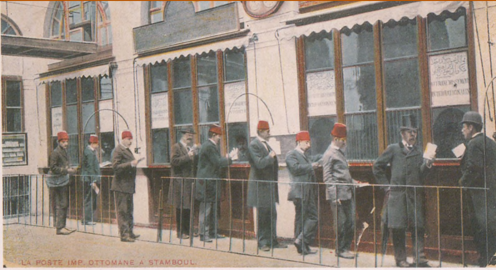
Redingotlu ve setreli Osmanlı erkekleri