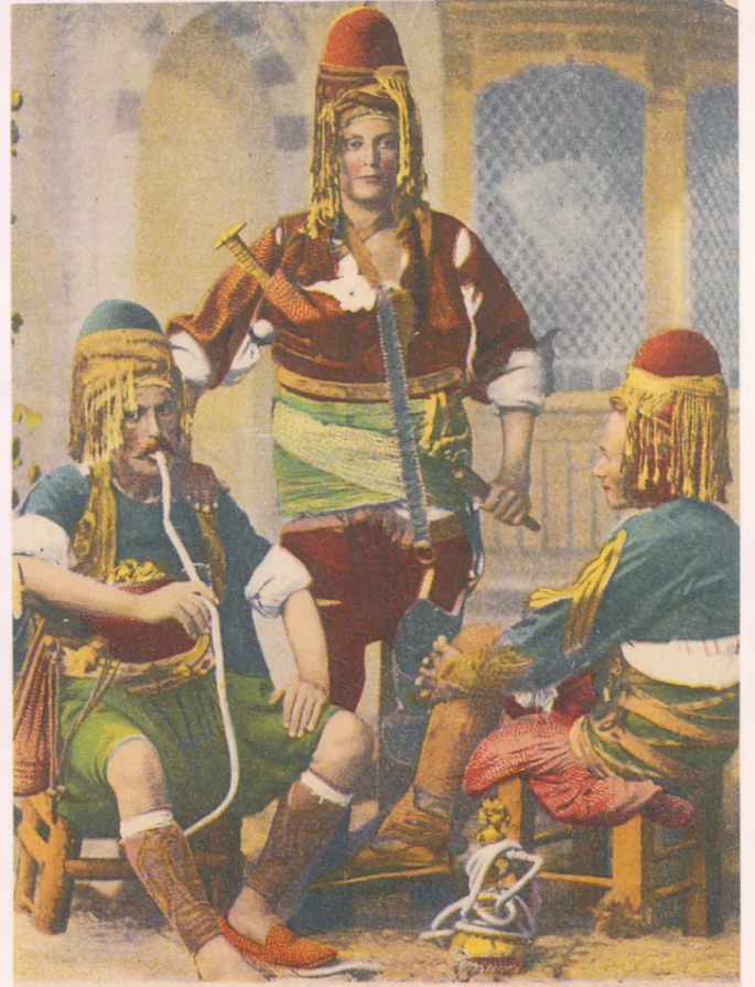
Salut de Constantinople. Zeibeks.

Erkek kıyafetleri, bilhassa XIX. yüzyılın sonunda modanın etkisiyle eskisine nazaran büyük değişiklikler geçirmiş, Avrupa'daki kullanımına ve buradaki moda uygun hale gelmiştir. Tabii ki bu tarz kıyafetleri toplumun ekonomik yönden kuvvetli ve medeniyet görüşü olarak da Batıyı özellikle şekil bakımından taklit eden kesim tercih etmekteydi.