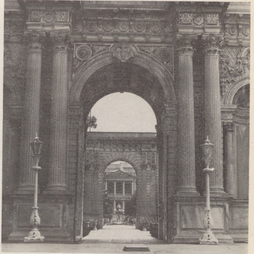
DOLMABAHCÉ SARAYI— Hazine Kapısı'ndan ana binaya bakış.

Setli bahçeler halinde düzenlenen saray alanı Geyiklik adıyla anılan kuru ile Nakkaştepe sırtlarına doğru tırmanmaktadır. Boğaz Köprüsü'nün yapılması ile önemli bir kısmı yok olan Beylerbeyi Sarayı Bahçesi içerisinde, Saray yapısı dışında bugün