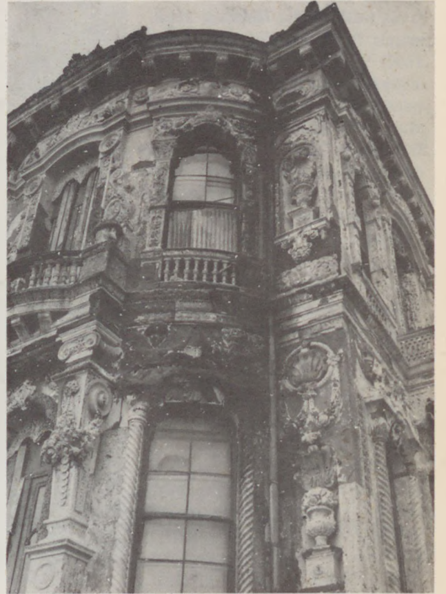
KÜÇÜKSU KASRI—Cephe Detayı