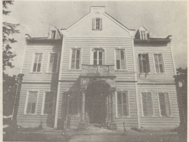
MASLAK KASRI HUMAYUNU