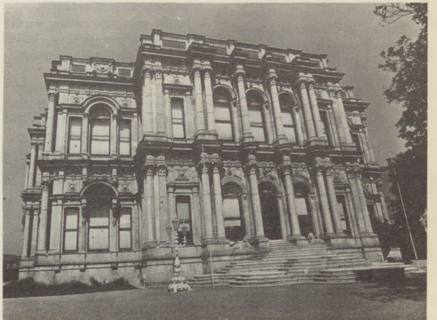
BEYLERBEYİ SARAYI— Güneybatı Cephesi

SÖZEN: T.B.M.M. Başkanlık Divanı ilk kez böyle bir sempozyum dü-