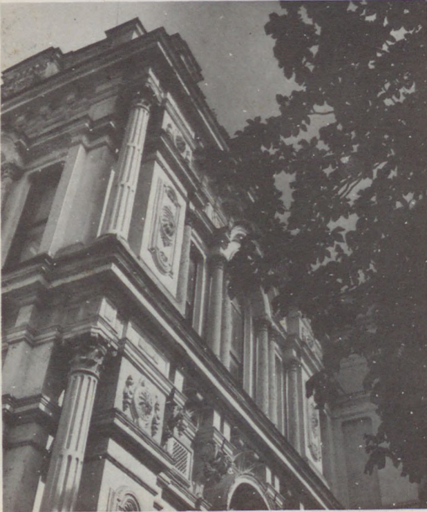
BEYLERBEYİ SARAYI—Cephe detayı

İstanbul'da bulunan hasbahçeler içinde yer alan ve adı H.1306 (1626-27) tarihli mevacib (aylık) defterlerinden itibaren geçmeye başlayan Bağçe-i Göksu'nun kesin sınırları ne yazık ki bilinmemektedir. Buna rağmen Bağçe-i Göksu'nun Göksu ve Küçük Göksu (Küçüksu) dereleri arasında yer alan Küçüksu (Göksu) çayırı olduğu söylenebilir. IV. Sultan Murad (1623-1640) tarafından düzenlenip güzelleştirilen bu bahçede ilk defa I. Sultan Mahmud (1730-1754) devrinde iki katlı bir saray yaptırıldığı bilinmektedir. II. Sultan