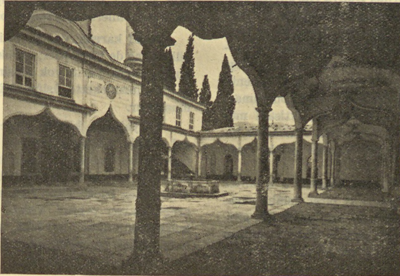
Bursa — Emir Sultan camii'nin avlusu Bursa — Cour de la mosquée Emir Sultan