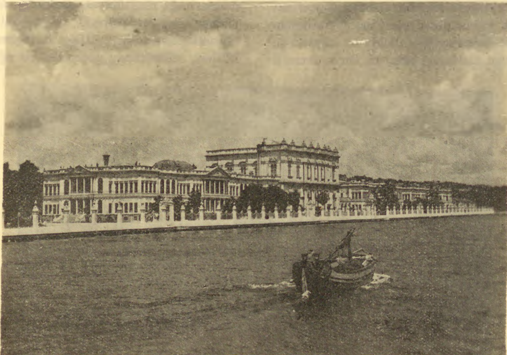
İstanbul — Dolmabahçe Sarayı Istanbul — Palais de Dolmabahtché

Bundan başka yeni devletin merkezi olan Ankara, büyük bir memur kitlesini barındırmak zorundadır. Böyle bir küçük ortaçağ beldeciği-