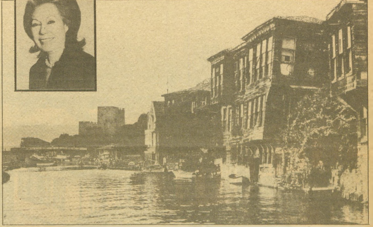
Göksu Arappaşa Yalısı,