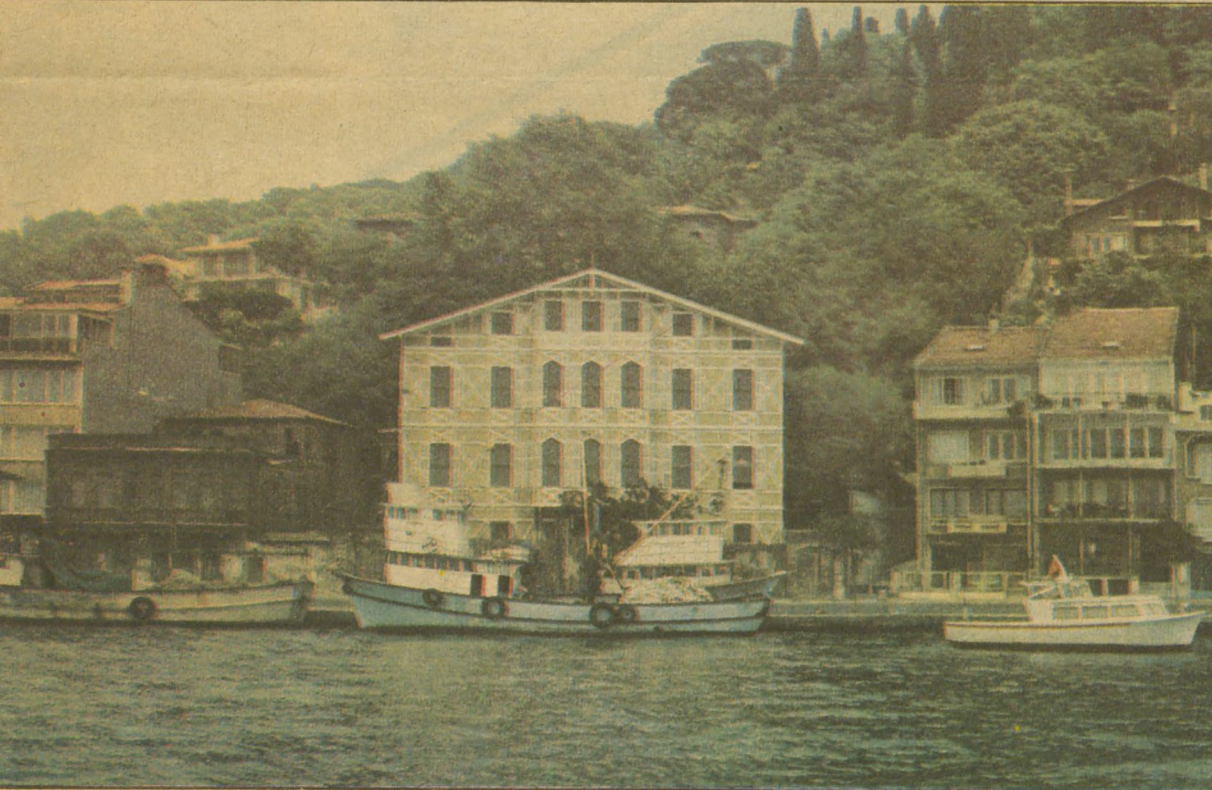
Ziverbey'de Razi Trak Köşkü (üstte) Büyükdere Sadberk Hanım Müzesi (altta)