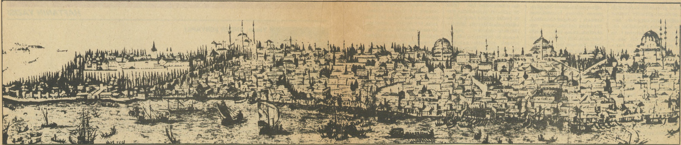
Sarayburnu - İstanbul yakası