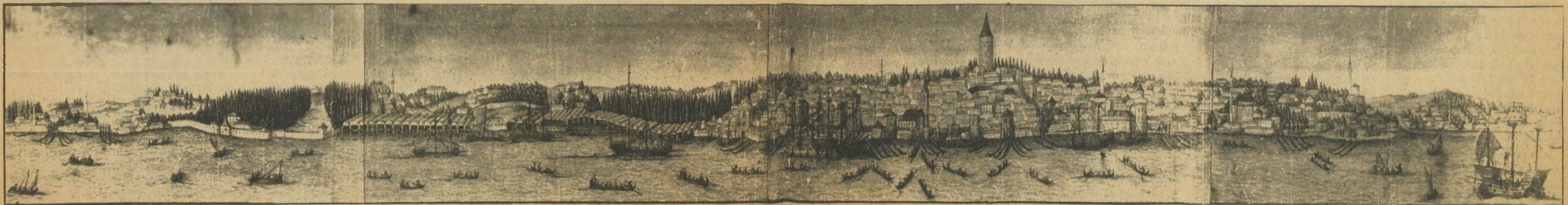
Galata (Fındıklı'dan Hasköy'e)