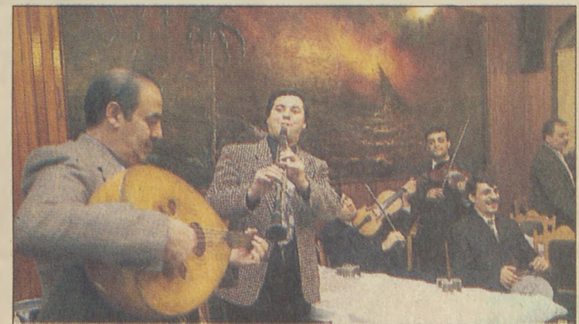
Kör Agop Meyhanesi - Kumkapı