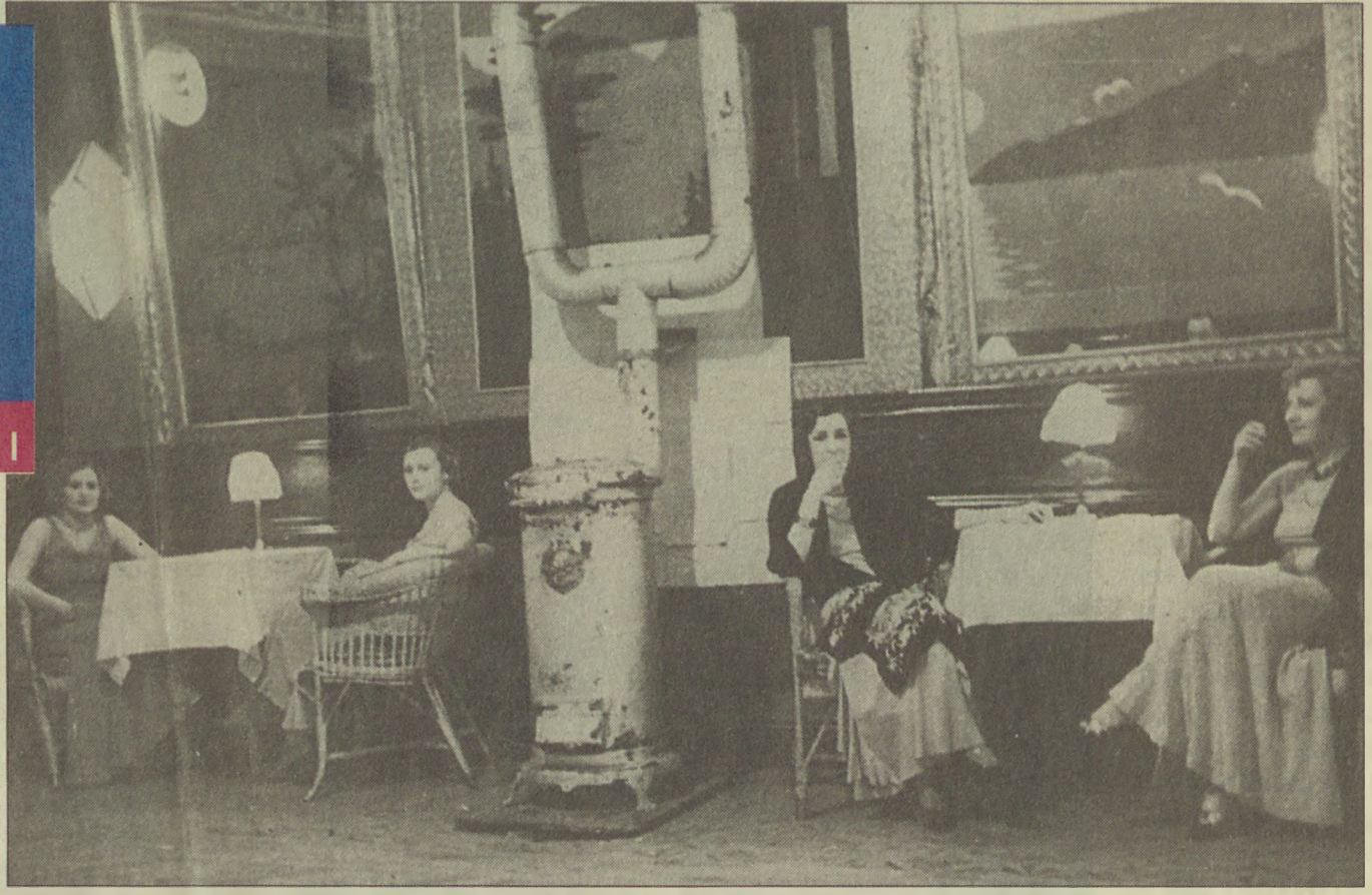
Meyhane kültüründen bar kültürüne geçişte kadınların rolü büyük. Resimde dönemin ünlü barı, Turan Bar'da yalnız başına oturan kadınlar görülüyor.