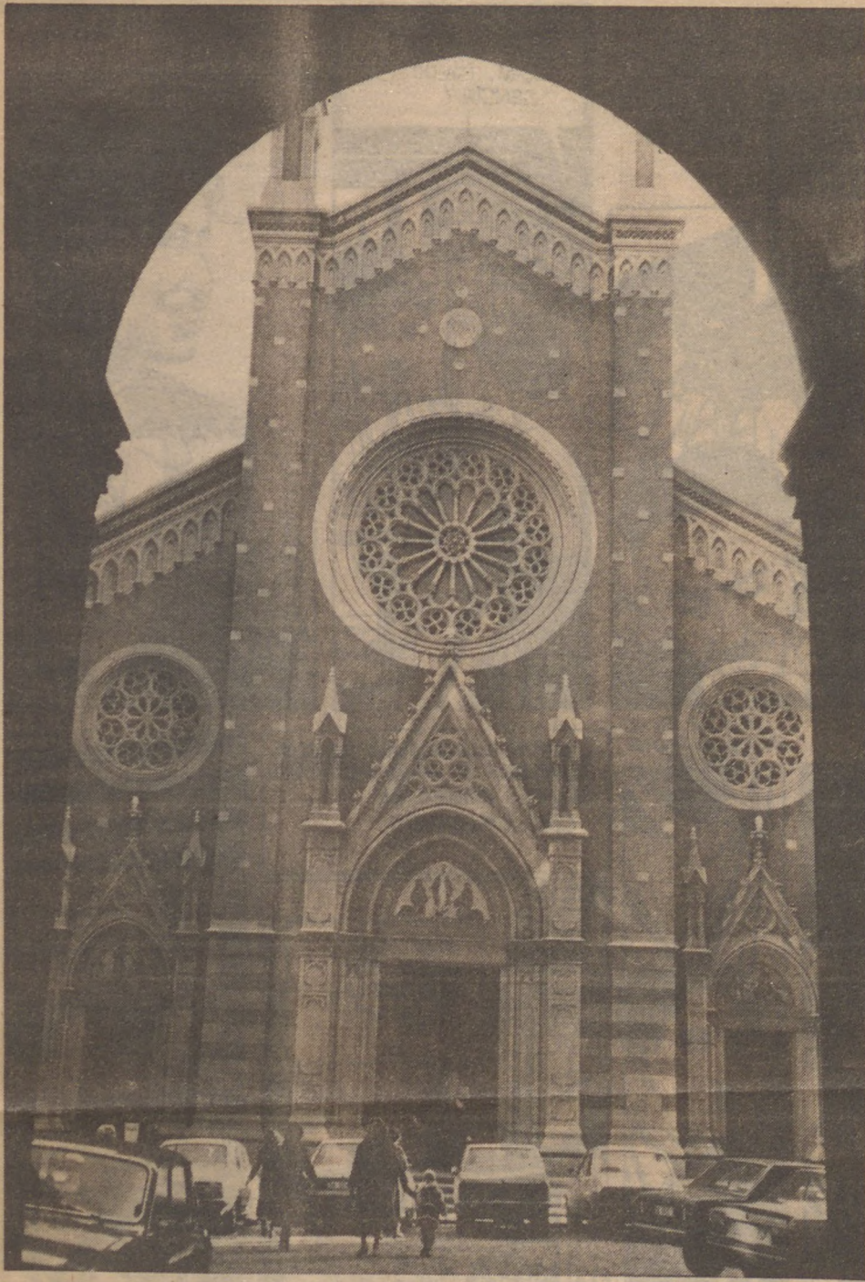
Sen Antuan Manastırı, İstanbul'un en civcivli semtlerinden biri olan Galatasaray'da.