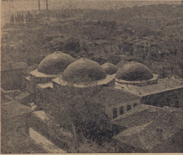
Üsküdar'da Çinili Hamam Bains dits Çinili Hamam à Üsküdar

İstanbul hamamcılar derneği çok haklı bir meseleyi ele almış bulunmaktadır.