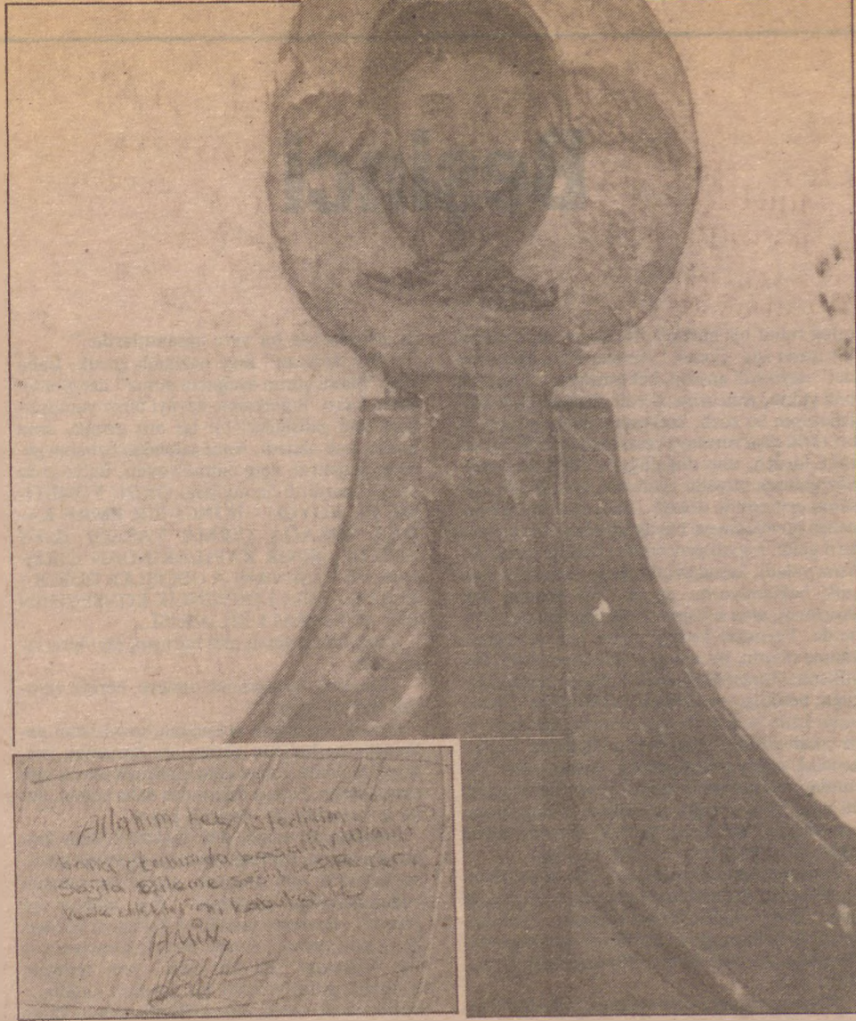
Ayazmanın duvarlarında, daha çok Müslüman Türklerin dilekleri yer alıyor.

Güzelim ülkemizde, gitgide, her ağaç dalı, her kaldırım taşı bir adak ve dilek sembolüne dönüşecek böyle giderse!.. □