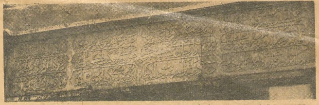
Cezayirli Gazi Hasan Paşa çeşmesinin üzerindeki kitâbe