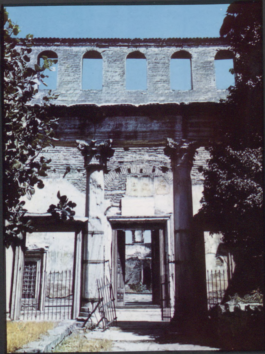
Hagios Joannes to Stoudiou Manastırı ve Kilisesi