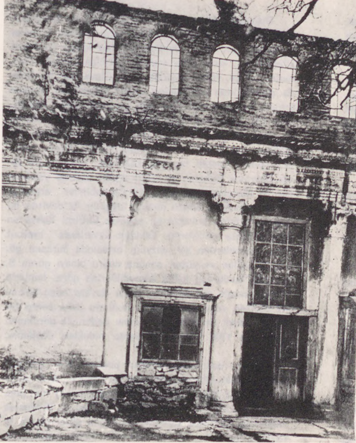
Doğudan batıya bakış - Asıl giriş kapusu ve diğer bir küçük kapı, kolonlar bunların üzerindeki frizler (1944 deki durum)