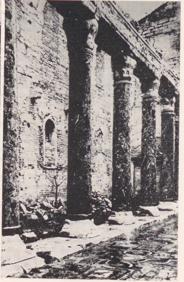
İmrahor camii - Zemin mozaikleri ve yeşil somaki kolonlar