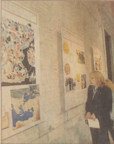
Ayasofya Müzesi'ni haftanın yedi günü gezmek mümkün.

Gezemesek de göremesek de destek vereceğiz diyenlere 'Yeni Yedi Harika' oylamasının 2002 sonuna dek sürdüğünü hatırlatalım. Adres şöyle: 'www.new7wonders.org'. (Ayasofya Müzesi: (0212) 522 17 50)