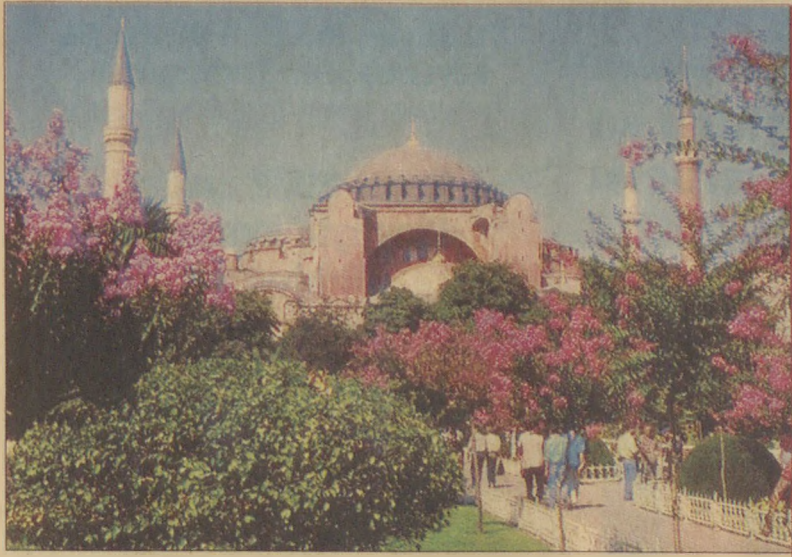
Mustafa Kemal'in isteğiyle 1934 yılında müze haline getirilen Ayasofya'yı bir yıl içinde 1 milyon 53 bin kişi ziyaret etti.