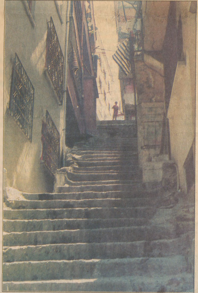
Bölgedeki insanların ev dışında biraraya geleceğe ortak alanlar çok az.

"Bunlar, içten gelişim, hem içten hem dıştan gelişim ve