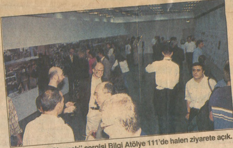
"Kuştepe'yi Okumak" sergisi Bilgi Atölye 111'de halen ziyarete açık.