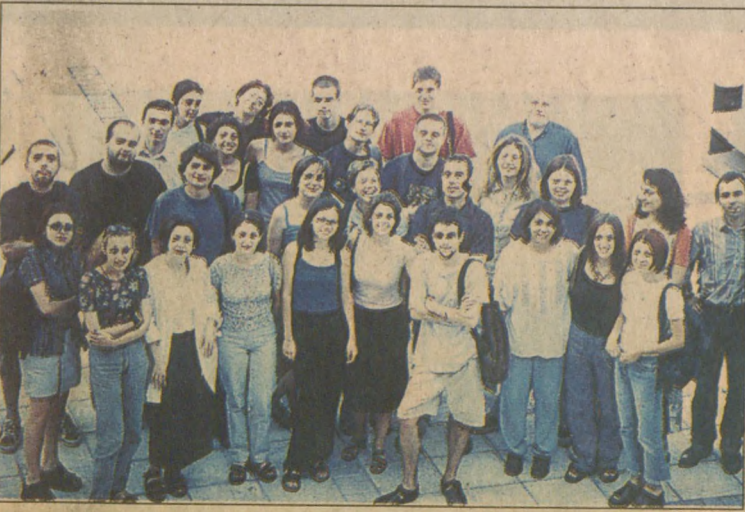
Araştırmayı 7 üniversiteden 24 öğrenci ile 10 akademisyen hazırladı.