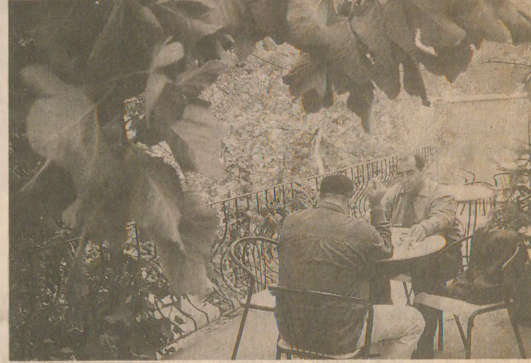
Heryer yemyeşil, otururken yapraklar dallar tarafından kuşatıldığını hissediyor, oturduğunuz yerden elinizi uzatıp incir yiyebilirsiniz.

Yeniköy Kahvesi'nin iskemlelerinin iskeleti demirden, kenarları plastik. Duvar kenarında mavi ve kırmızıya boyalı küçük hasır iskemleler var. Onların önündeki masalar büyük tekerleklerden oluşuyor, eski kağıt tekerleklerinin üzerine, daire şeklinde kalın