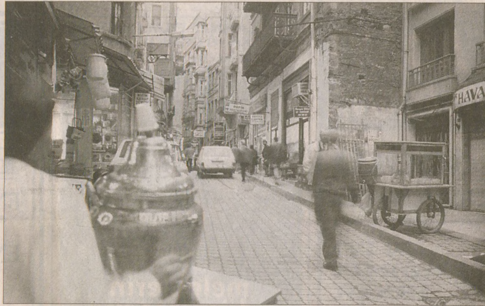
Yüz yıllınsilk yarısında bohemlerin mekanı olan Asmalımescit, yeniden hareketleniyor.

"Buraya ilk geldiğimizde tam bir harabe idi" diyen Öztürk, binanın içinden torbalar dolusu çöp çıkartmış. O zaman harap ve terk edilmiş bir halde bulunan bu binada bugün bir restoran ve Internet Cafe hizmet veriyor. "Biz geldikten sonra sokak iyice canlandı. Şimdi sokağın başına bir Jazz Club açmayı planlıyorlar, yanımızda birçok