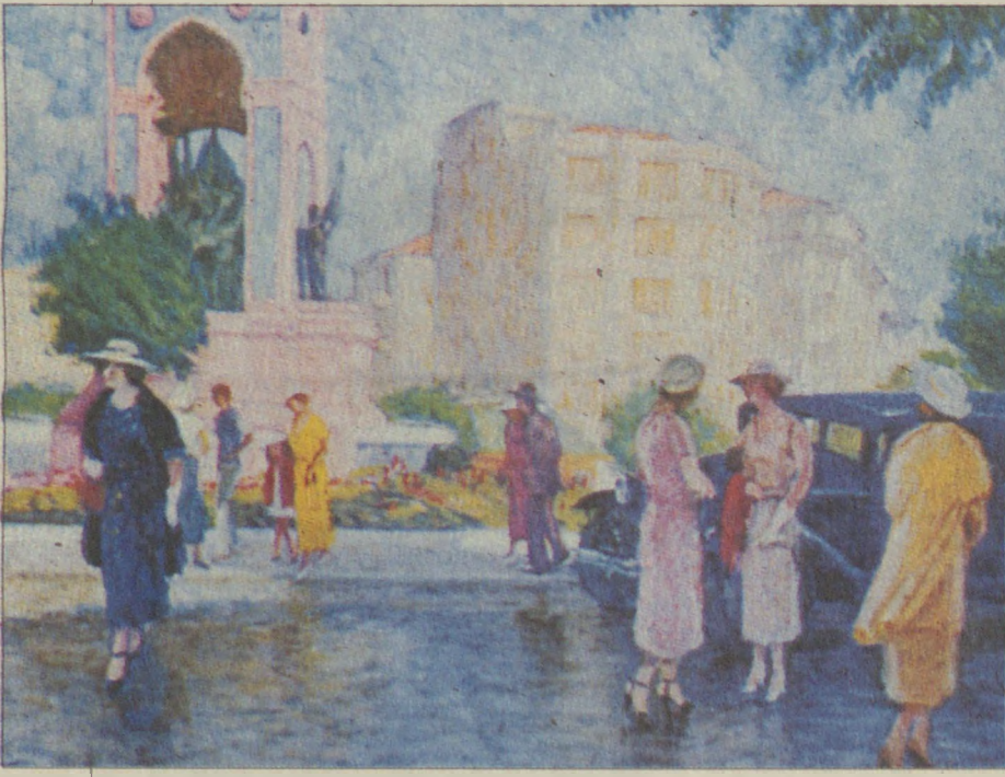
Nazmi Ziya'nın fırçasından 30'ü yılların Taksim Meydanı.

Tarihi su maksimi ve bitişindeki eski otopark alanı için 1994'de Mimarlar Odası'ndaki çalışmalarımızda bir "açık hava müzesi" önerisi geliştirmiştik. Kentin özellikle Osmanlı dönemindeki su uygarlığının belgelendiği ve sergilendiği mevcut Maksim binası ve buna bağlı tarihi yapılarla çevrelenmiş bir tarih parkı gibi. Sonra zaten buradaki arkeolojik sondaj kazılarında Bizans ve Osmanlı dönemine ait kalıntılar da çıktı. Bu önerimiz böylece daha da güç kazandı ve bence üzerinde durulmalı. Meydan da ancak bölgesel ölçekli ve koruma amaçlı bir planlama ve bununla ilişkili bir yeni ulaşım etüdü ve planlamayla ele alınmalıdır. Bu yapılmadan, en doğrusu şimdilik hiç dokunmamaktır.