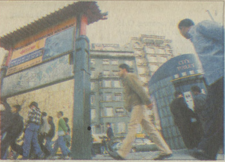
Taksim Meydanı denilince akla ilk ne gelir sorusunu sormak anlamsız. Anıtı, tramvayı, fiskiyeli havuzu, Etap Marmara'sı, çiçekçileri, boyacıları, Selpak satan çocukları, postahanesi, turistik amaçlı tuvaleti, parkı, kalabalığı, Taksim bunların hepsidir.