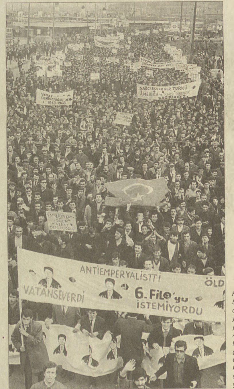
Kanlı Pazar'ın bilançosu iki ölü ve yüzlerce yaralı oldu. Alana toplanan göstericilerin üzerine kurşun, taş ve sis bombası yağdı.

Kanlı Pazar'da açılan ateş ve insanların yaşadığı panik, 1 Mayıs 1977'nin provası gibiydi.