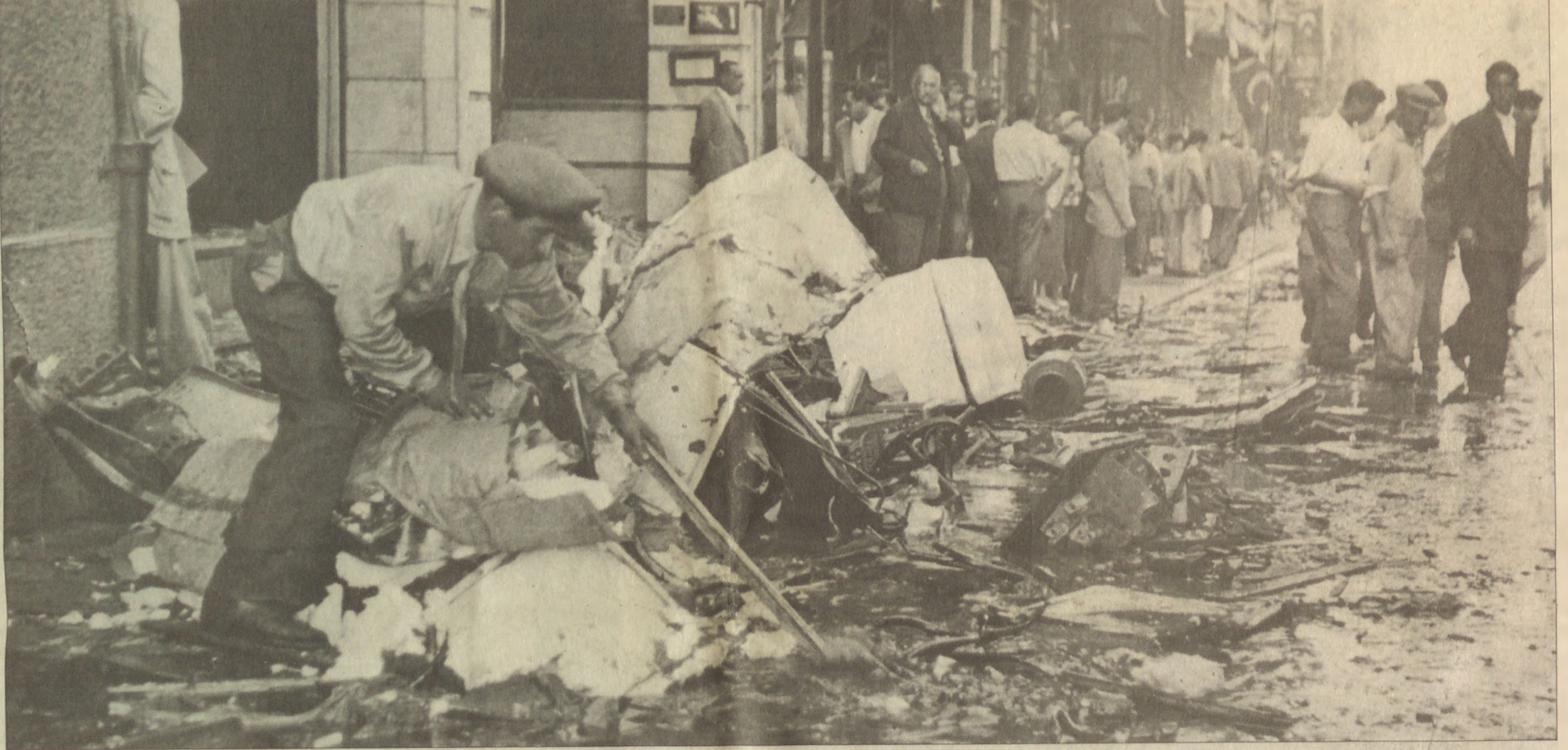
7 Eylül günü Beyoğlu... Sokaklardan geçmek, kırılan cam, çerçeve ve yağmalanan mallar yüzünden imkansız hale gelmişti...

31 MART, 6-7 EYLÜL, KANLI PAZAR VE 1 MAYIS 1977. OLAYLI MEYDAN KİMLİĞİ TAKSİM'İN KADERİ OLDU