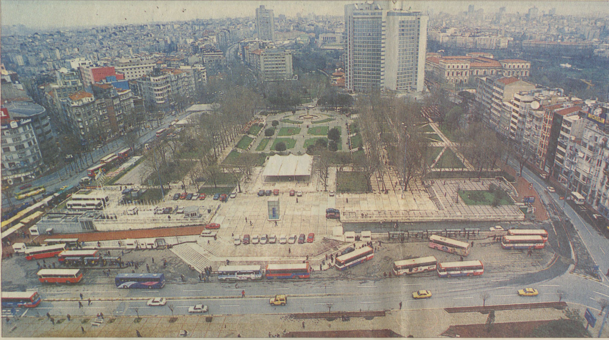
Beyoğlu, bölgesi 1994'den beri kentsel SİT kararıyla bölge ölçeğinde korunmak isteniyor. Ancak koruma amaçlı imar planı bir türlü yapılamıyor.