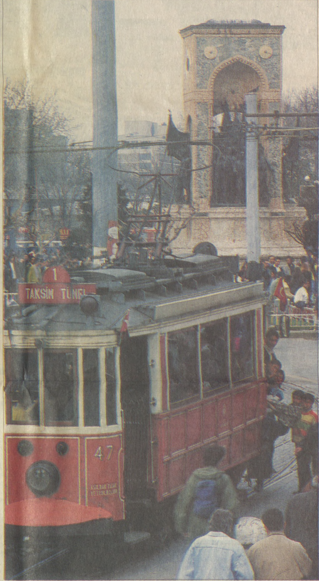
Beyoğlu'ndan Taksim'e tramvayla çıkışın değişmez görüntüsüdür, arkaya asılmış, her an düşmek üzere olan çocuklar.

Bir de tramvay durağının hemen önündeki "modern tuvalet"ten bahsetmek gerek. Kullanımı az, seyreden fazla olan bu