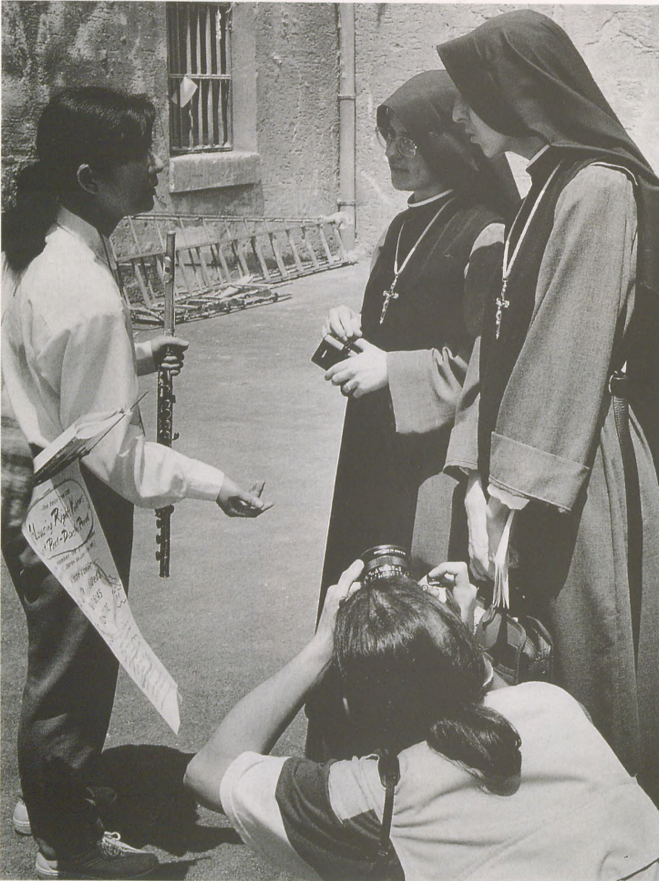
Taşkısla'da müzik, sohbet ve fotoğraf...