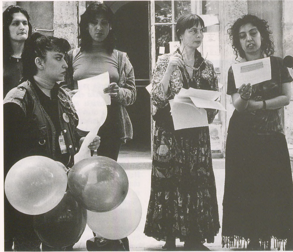
Taşkışla'da kâğıtlar, gazeteler ve tebliğler...