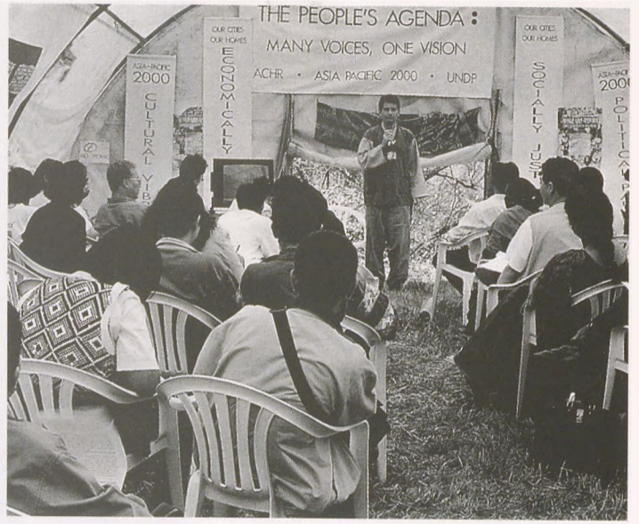
Taşkısla'nın içinde ve dışında...