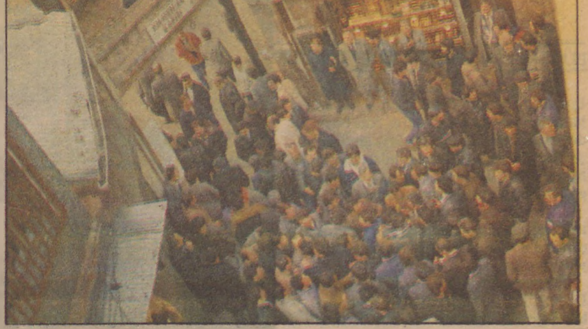
Cuhacı Hanı'nın önü her sabah böyle —Döviz borsasının nabzı burada atıyor—

Burası çarşığı ziyaret eden yerli ve yabancıların uğrak yeridir. Birçok ünlü, Şark Kahvesi'ni ziyaret etmiştir. Belediyeye ait olduğu için 300-500 bin lira arasında düşük kirası vardır. Havuzlu Restoran da tüzük gereği düşük bir kira öder. Türk mutfağından yerli ve ya-