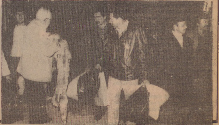
Turistlere ayaküstü satış yapmaya çalışanlar —Pazarlık alabildiğine serbest—

YUNANLILAR: İşte Kapalıçarşı'nın yeni gözdeleleri. Bir dükkâna girdikleri zaman, "Aman esnafı darıltmayayım" çekingenliği içinde görünürler. İlk girdikleri esnafın alışveriş yapmak isterler. Fiyatları, mal sahipleri için oldukça caziptir. Pazarlığa girmezler •