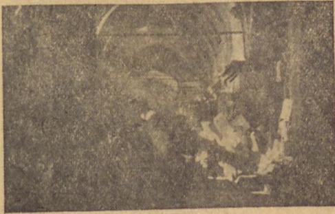
Bugünkü Kapanlıca'dan bir görünüşü

Bedestenin eski muhafaza ve idare teşkilâtı: Bir taraftan kıymetli eşyanın alım satım borsası, diğer taraftan da kıymetli eşya bankası olan Bedesten, «Bölükbaşı» denilen on iki kişi tarafından muhafaza edilirdi. Bunlar açık arttırma ile satışlarda dellâllik da yaparlardı. Bölükbaşılara saraydan tayin edilmiş «Nanpareci» ile «Küçük ağa» nezaret ederlerdi. Bölükbaşılar birbirlerine zincirleme kefindiler ve ellerinde ayrı ayrı fermanları vardı. Münhal oldukça yeni bölükbaşının eskiler tarafından seçilmesi gelenek olmuştu. Bunlara sonradan on iki gezgin dellâl ilâve edilmiştir ki bunların vazifesi Padişahlar değıştikçe taşraya haber ulaştır-