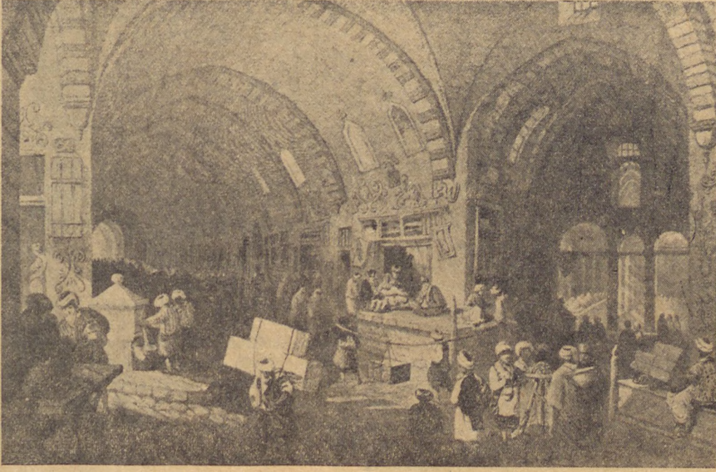
Kapanlıca'dan eski bir görünüşü

Lâkin, her ne pahasına olursa olsun, bu işi başarmak lâzımdı. Zira, nüfusunun yüzde seksenini köylüler teşkil eden ve halkın egemenliği esasına dayanan devletimiz, bünyesinin tabii ve zarurî bir mahsulü olarak ziraî reform hareketine girişmek, tamamen topraksız veya toprağı yetmiyen çiftçi ve köylüyü toprağa sahip kılmak mecburiyetinde idi. Aksi halde, büyük toprak mülkiyetine dayanan unsurların köylü üzerindeki tesir ve nüfuzları, hem iktisaden, hem de siyasi bakımdan rejimimizi zayıf, verimsiz bırakmakta devam edecekti.