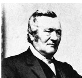
Jón Hjaltalín (1807-1882)