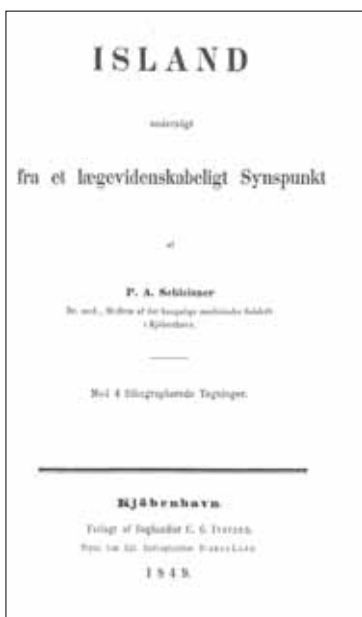
Mynd 6. Forsíðan af „ Island undersøgt fra et lægevidenskabeligt Synspunkt “. 27

Í Vestmannaeyjum var aðgangur lélegur að fersku vatni. Hér og þar og við húsin voru þrær. Regnvatn var notað til drykkjar, við matseld, þvotta á fatnaði og fólki. Oft var vatnið mengað af aðrennsli frá skepnunum, af dauðum fuglum og öðrum hraejum sem lágu rotnandi á jörðinni. Einnig lék grunur á því að klútar sem