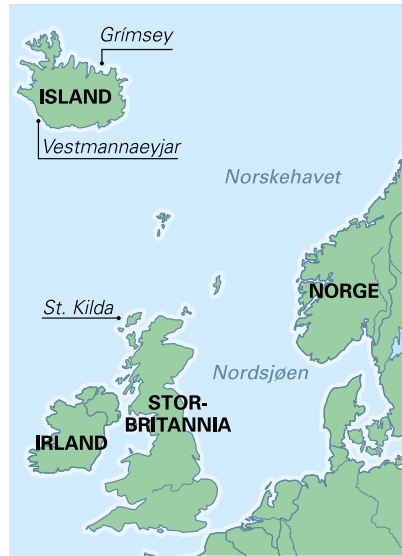
Mynd 2. Kort af Norðursjó, þar sem sjást Grímsey, Vestmannaeyjar og St. Kilda.