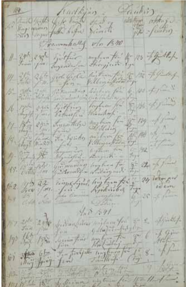
Mynd 4. Kirkjubók fyrir Vestmannaeyjaprestakall (1840). Dánir af „Karlkjón“ með dánarorsök og aldri barns í dögum (dálkar 1 og 3 frá hægri). Dánarorsök var í nær öllum tilvikum „af Ginklofi“, þar sem við á „af samma“.