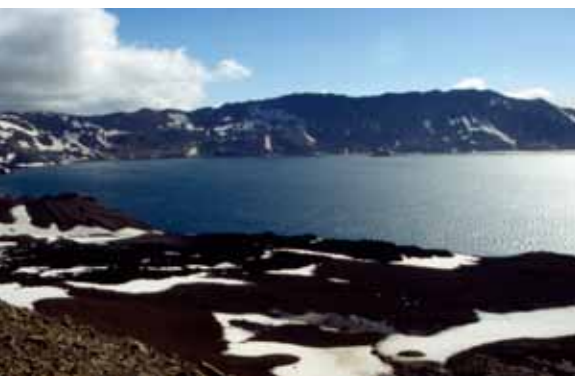
Löngum hefur óhugnaður ríkt yfir frásögnum af hinu skyndilega hvarfi Walthers von Knebel jarðfræðings og Max Rudloffs málara í Öskjuvatn 10. júlí 1907.

Frumvá getur líka verið falin í skaðlegum lofttegundum sem fylgja eldgosum. Koltvíldi ( \text{CO}_2 ) losnar oft í miklu magni við eldgos og á jarðhitasvæðum. Hættan fyrir lífandi verur felst í því að lenda í \text{CO}_2 -skýi eða fláumi en það getur til dæmis gerst ef lofttegundin nær að safnast fyrir og losnar síðan skyndilega. Gas getur safnast fyrir á botni stöðuvatns og losnað þegar hrist er upp í vatninu við jarðskjálfta eða skriðuföll. Þetta