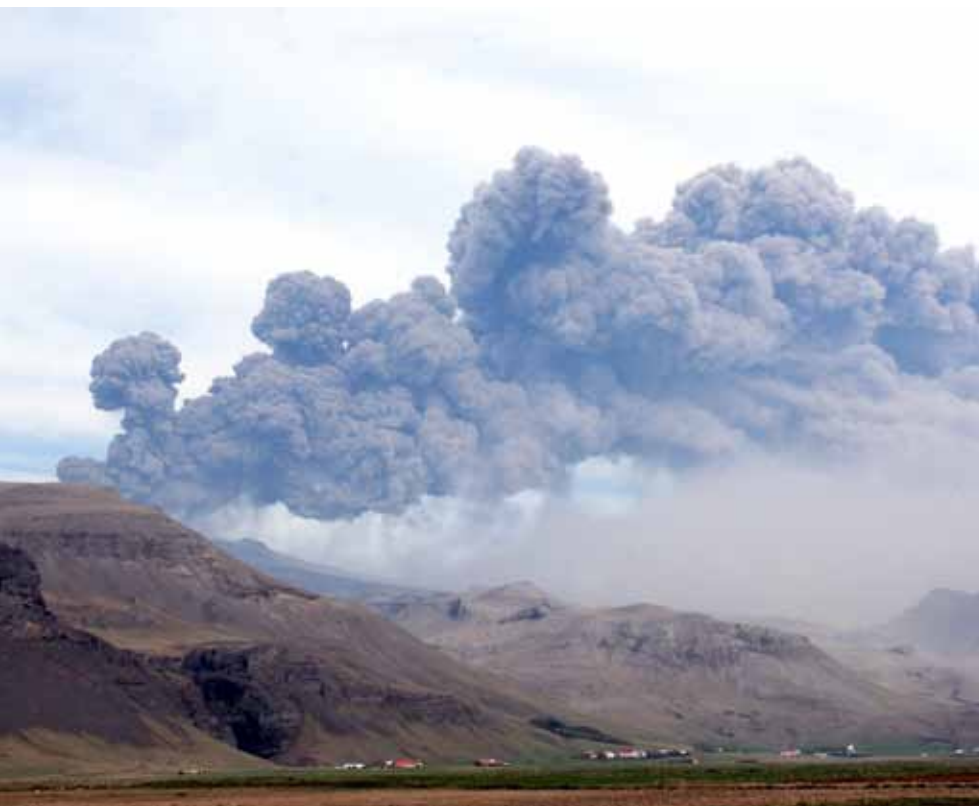
Öskufall var gifurlegt undir Eyjafjöllum.

verið safnað með spurningalistum sem sendir voru tæplega tvö þúsund manns á aldrinum 18 til 80 ára. Til samanburðar eru tæplega 700 Skagfirðingar á sama aldri. Þegar þetta er skrifað í byrjun maí 2011 er gagnasöfnun nær lokið og innsláttur gagna hafinn.