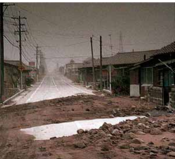
Ummerki eftir hrauneðju í japönsku þorpi.

og kostaði nær þúsund manns lífið. Hrauneðja (e. lahar) er blanda vatns og hrauns sem flýtur svipað og blaut steypa og getur náð miklum hraða eftir árfarvegum eða niður í móti. Slík eðja getur valdið miklum skaða, síðast árið 1985 í Kólombíu þar sem 23 þúsund manns fórust.