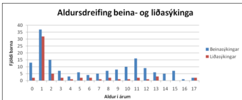
Mynd 1. Aldursdreifing barna með beinasýkingar og liðasýkingar.