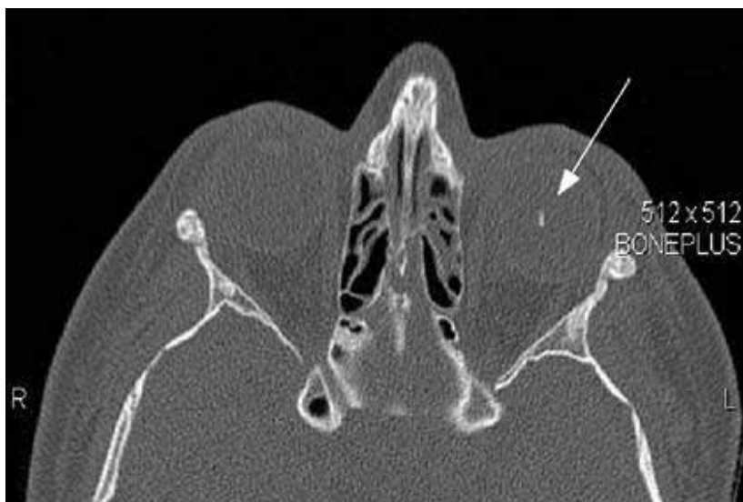
Mynd 4. Tilfelli 2: Sneiðmynd af höfði. Örin bendir á glerflís í vinstra auga eftir skoteldasprengringu.

Premur vikum eftir áverkann var líðan allgöð, en drengurinn kvartaði um augnþurrk. Sjónskerpa var 0,7 á báðum augum. Hornhimnusárin voru gróin en djúp ör á báðum hornhimnum. Skoðun var gerð rétt rúmu ári eftir slys og var líðan hans góð. Hann hafði ekki verið að nota neina augndropa. Við skoðun var sjónskerpa á hægri auga 1,0 og 0,8 á vinstra auga. Það var enn að sjá sót í augnslímhúð beggja vegna og einnig í hornhimnu (sjá mynd 3). Ör voru til staðar á hornhimnu. Að öðru leyti var skoðun eðlileg, forhólf, augasteinn og augnbotn í lagi.