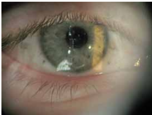
Mynd 3. Tilfelli 1: Skoðun ári eftir slys. Sót sést í augnslímhúð og hornhimnu.

búið um með sýklalyfjasmyrslum og grisjum. Daginn eftir voru líknarbelgslinsur (Prokera ® ) lagðar í bæði augu. Meðferð var hafin með steradropum, sýklalyfjadropum og augndropum sem víkka ljósop. Einnig var drengurinn settur á tetracyclín-töflur og á háa skammta af C-vítamíni. Tetracyclín verndar gegn skaða í uppistöðuvef (stroma) hornhimnu. 3 C-vítamín (askorbínsýra) flýtir gróanda og notkun þess í alvarlegum bruna á hornhimnu er tengd betri útkomu á sjón, en C-vítamín hefur andoxandi eiginleika. 4