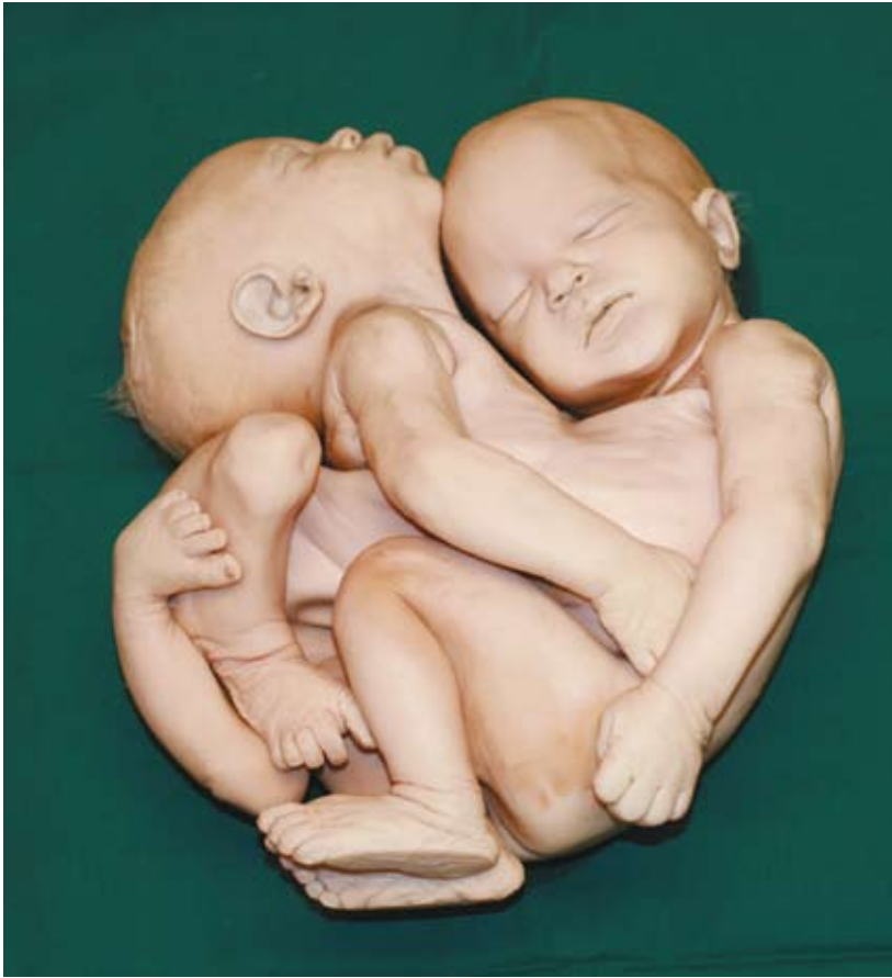
Mynd 1. Samvöxtur fóstura. Ljósmynd og teikning Hannesar Petersen.

á báðum, en rétt mynduð að öðru, með tveim höfðum, fjórum fótum og öðrum skapnaði. Þau lifðu meir en árstíma (eður tvö ár) og dóu bæði undir eins.