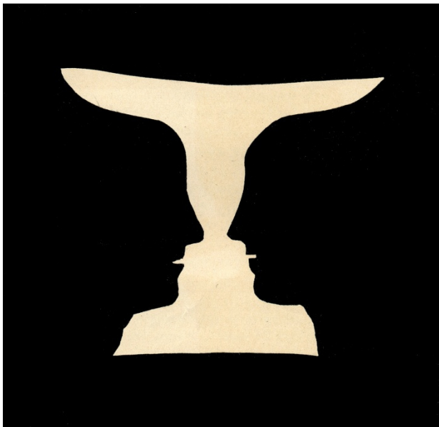
Mynd 2. „Vasi Rubins“ (Rubin, 1915).

Til að lýsa þessum mun bjó hann til nokkrar myndir. Ein þeirra hefur orðið öðrum frægari, sú sem sést hér á mynd 2.