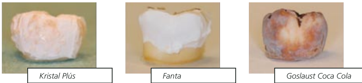
Mynd 1. Ljósmyndir af tannhlutum sem legið hafa í mismunandi drykkjum í 9 daga. Figure 1. Photographs of toothpieces after lying in different drinks, as labelled, for 9 days.

Þegar á heildina er litið sýndu íþrótt- og orkudrykkir mestu glerungseyðandi áhrifin, en sykraðir drykkir sem innihalda sítrónusýru fylgdu þeim fast á eftir (Tafla 3). Vatnsdrykkir sem innihalda sítrónusýru sýndu svipaðar niðurstöður og cola-drykkir.