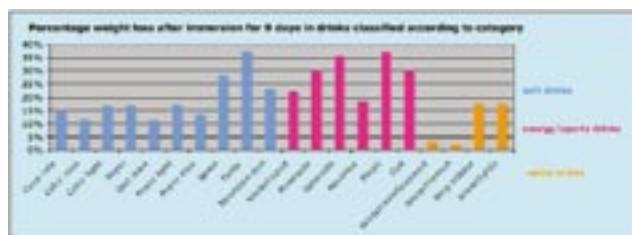
Tafla 3. Meðal þyngdartap tannhluta í mismunandi gosdrykkjasýnum flokkaðir eftir gerð drykkja. Table 3: Average weight loss of tooth pieces in the different drinks classified according to the particular brand.