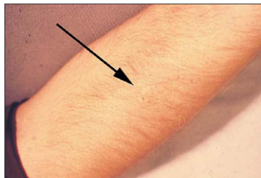
Mynd 2b. Nærmynd af stungustað. Hér að neðan sést greinilega byrjandi ofsakláðaútbrot (wheal).