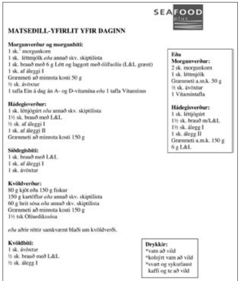
Mynd 1. Dæmi um 1400 hitaeininga matseðil sem notaður var í rannsókninni.

Skráning gagna fór fram í Excel, en SPSS forritið